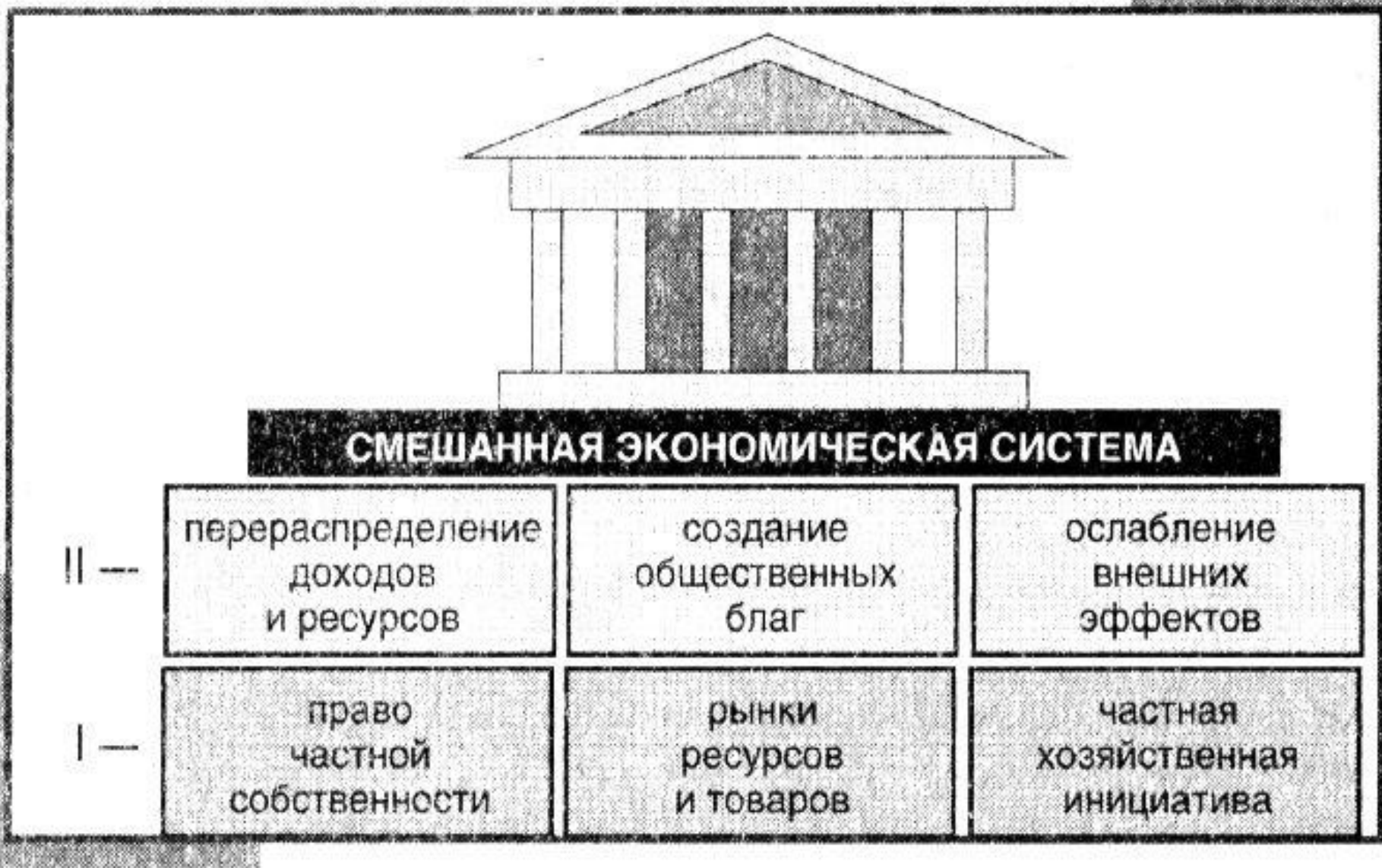
Рис. 3.3. Основные элементы смешанной экономической системы: I — сфера действия рыночных механизмов; II — сфера действия командных механизмов, т.е. контроля со стороны государства