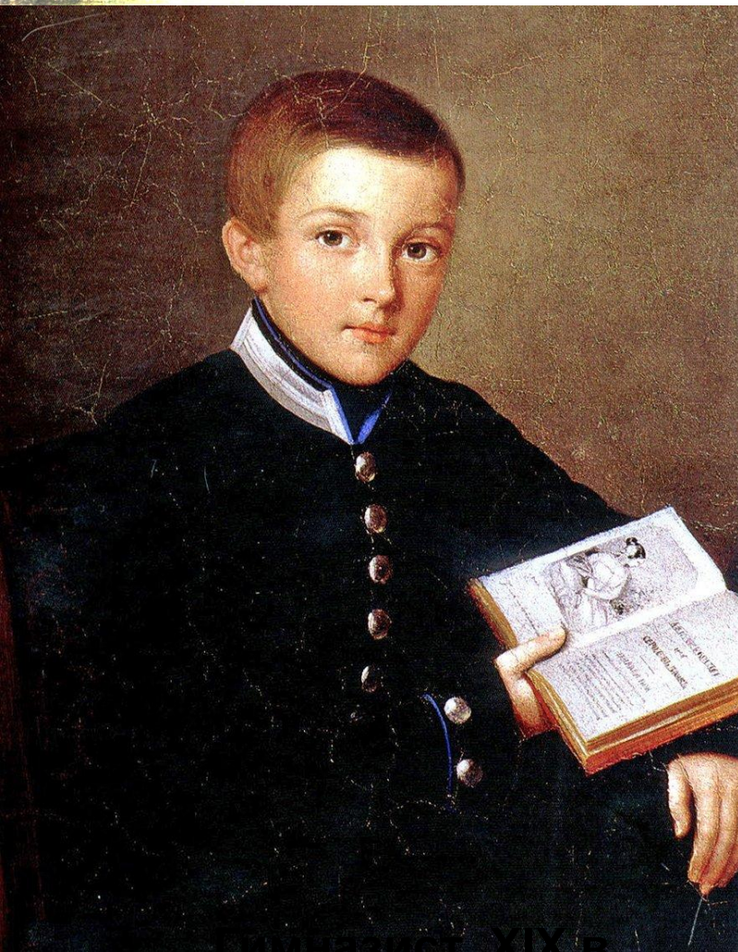
Гимназист XIX в

ярко выраженный сословный характер образования как исключение - возможность перевода в уездное училище, затем в гимназию одаренных детей