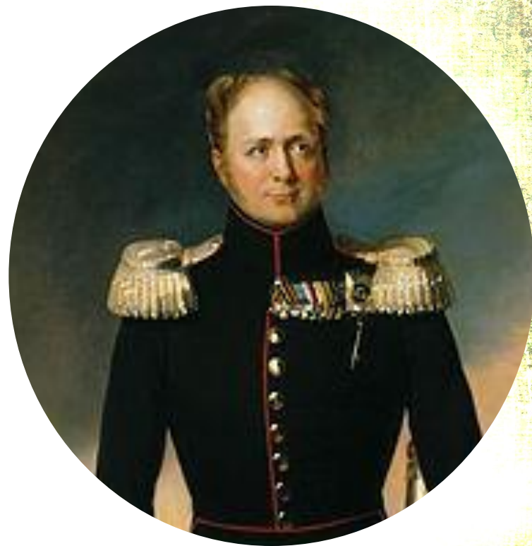
Александр I 1777 – 1825гг