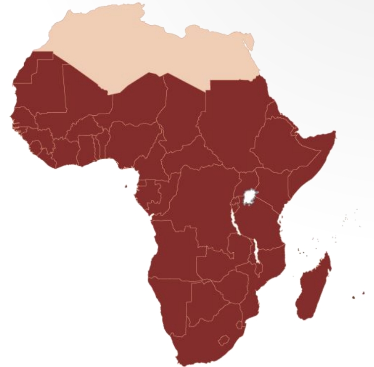
Черная Африка – Африка южнее Сахары