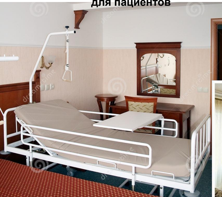
Специальные кровати для пациентов