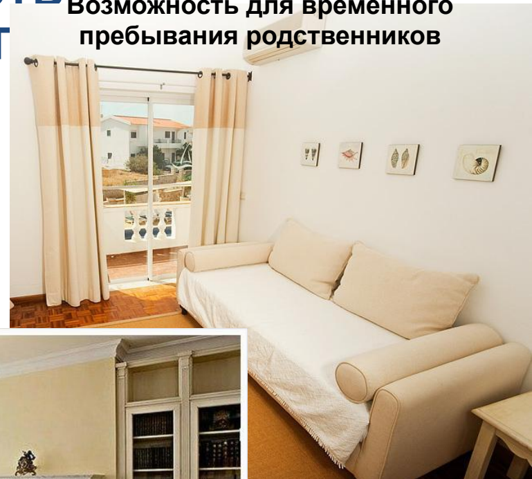
Каминный зал с библиотекой