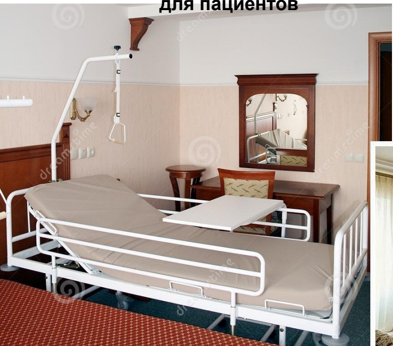
Специальные кровати для пациентов

Возможность для временного пребывания родственников