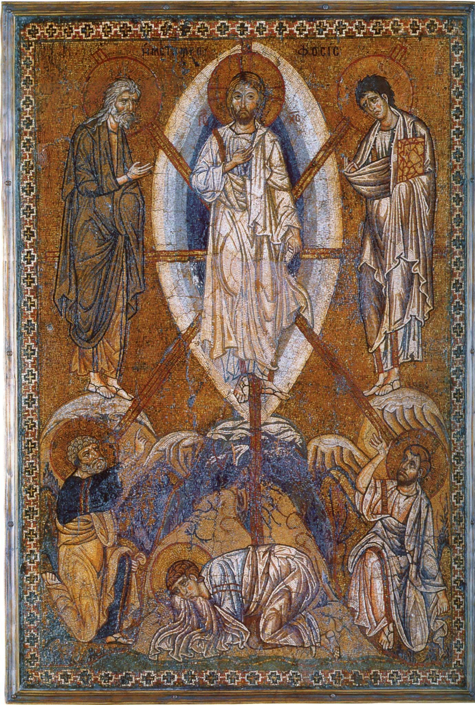
Мозаическая икона. Преображение господне. Византия. 1-ая половина XIV в. Лувр, Франция