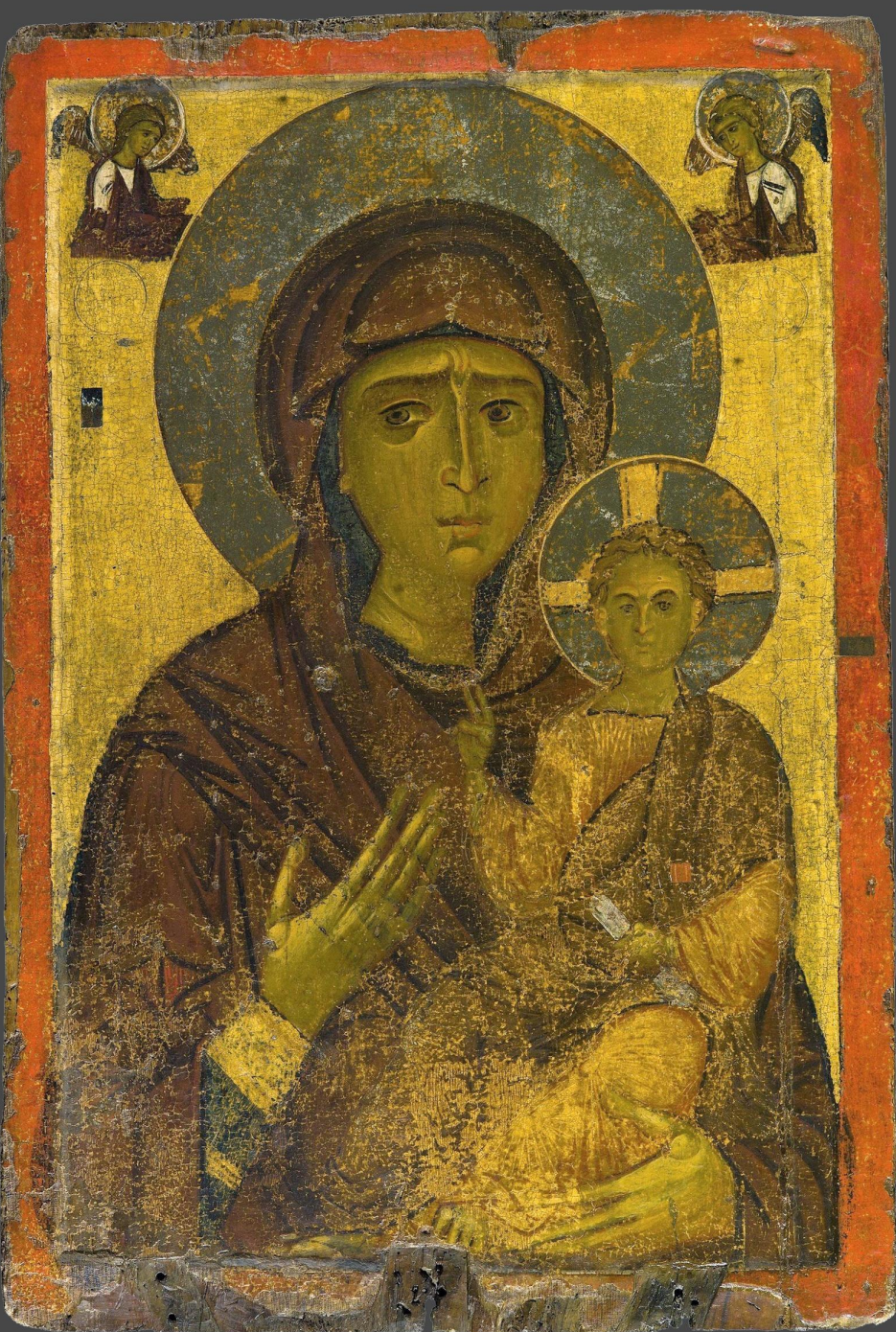
Одигитрия. Византийский музей в Кастории, Греция