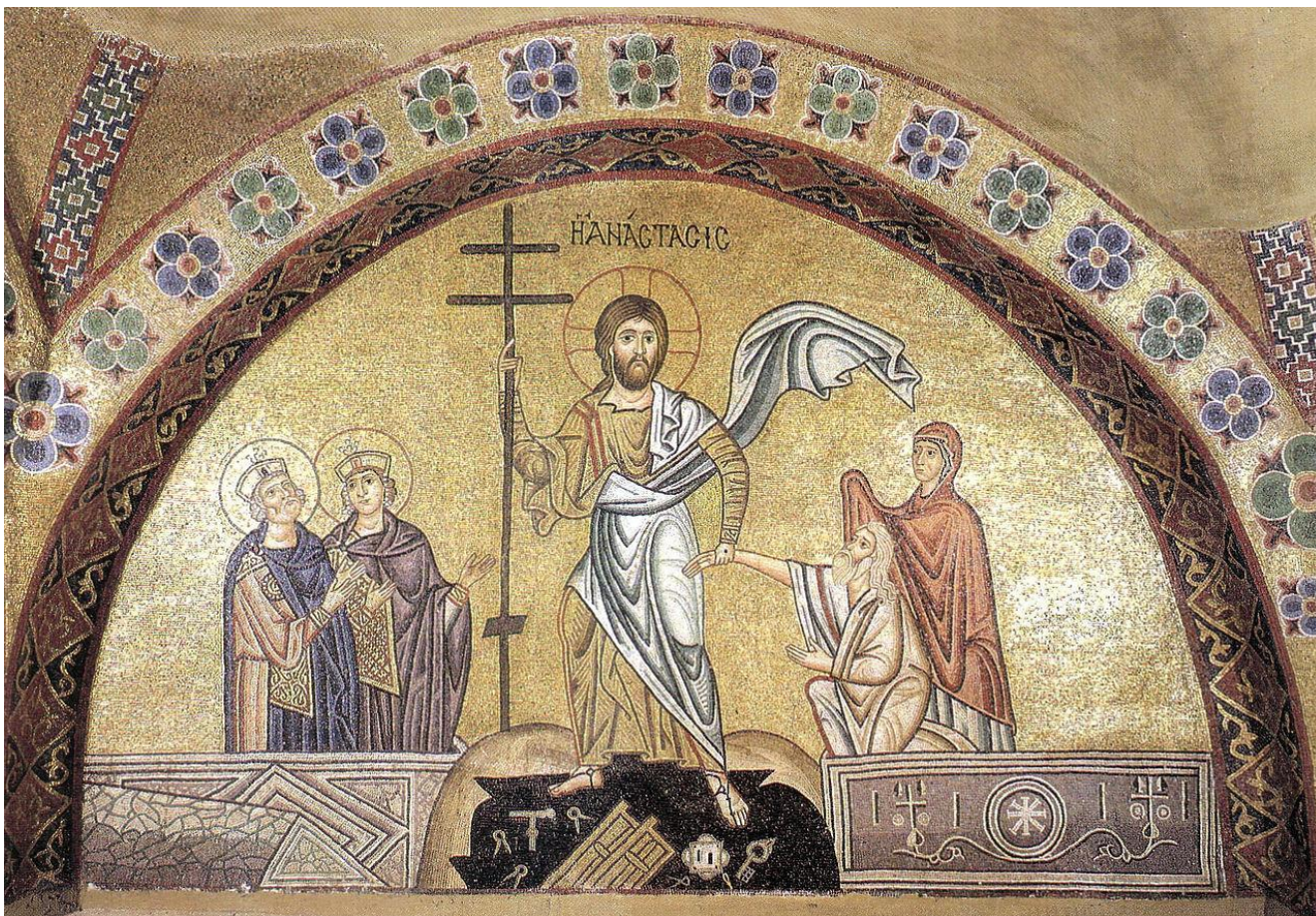
Воскресение. Мозаика монастыря Осиос Лукас