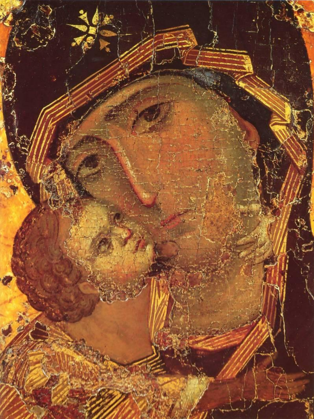
Владимирская икона Божьей Матери