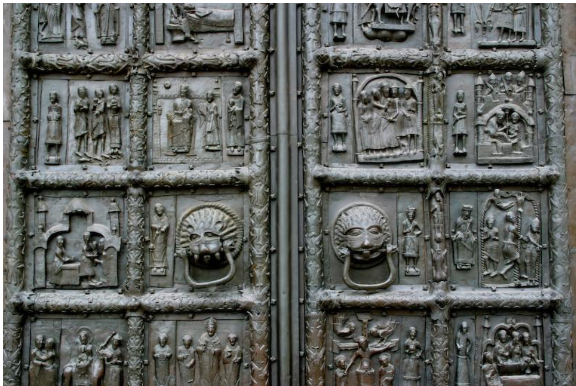
Магдебургские врата Софийского собора в Великом Новгороде