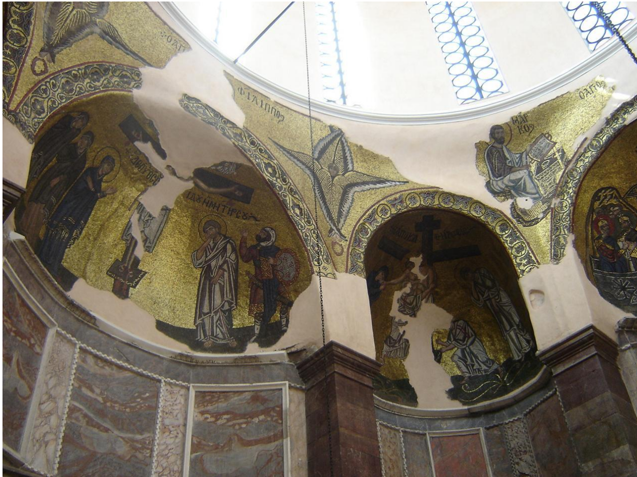
Мозаики Неа Мони(храм) на Хиосе(остров)