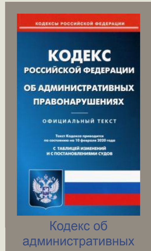
Кодекс об административных правонарушениях

-посягающее на государственный или общественный порядок, на собственность, права и свободы граждан либо на установленный порядок управления противоправное, виновное действие или бездействие, за которое законодательством предусмотрена