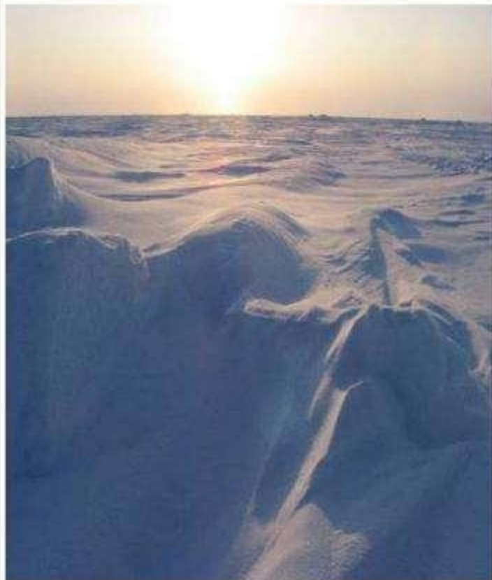
АРКТИЧЕСКАЯ ПУСТЫНЯ ЗИМОЙ