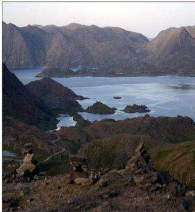
АРКТИЧЕСКАЯ ПУСТЫНЯ ЛЕТОМ