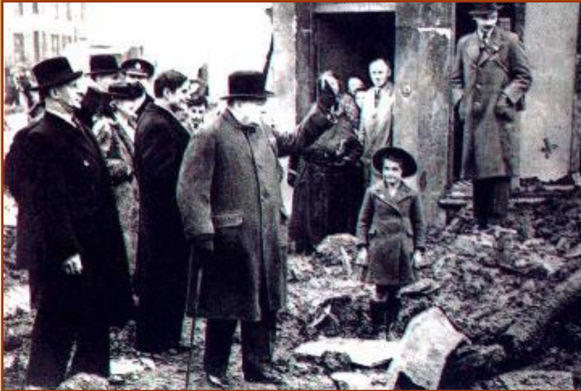
Черчилль на развалинах после немецких бомбардировок

Гитлер планировал высадить десант на Британские острова, но страну прикрывал мощный британский флот. В середине 1940 г. Германия начала массовые бомбардировки Англии. Английские ВВС и ПВО смогли дать немцам достойный отпор.