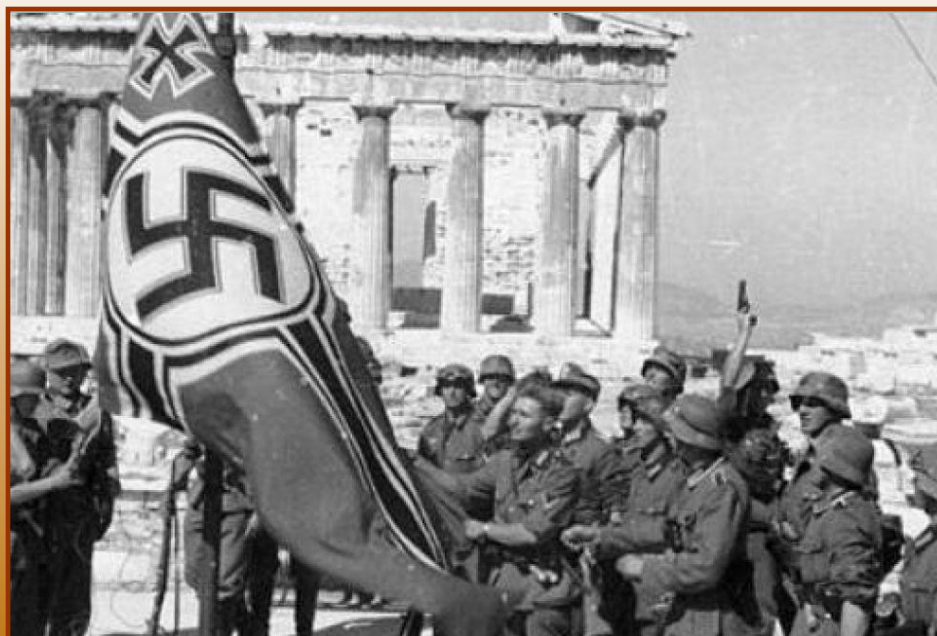
Немецкие войска в Афинах

1941 г. – захват Германией Югославии и Греции