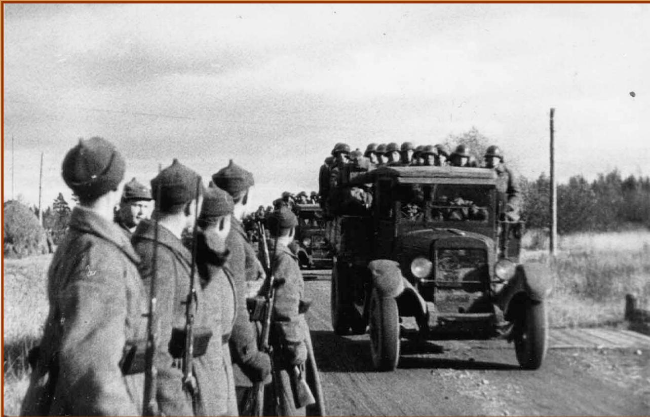
Ввод советских войск в Прибалтику

Под угрозой вторжения Латвия, Литва и Эстония согласились разместить на своих территориях советские военные базы, и в июне 1940 г. советские войска заняли Прибалтику.