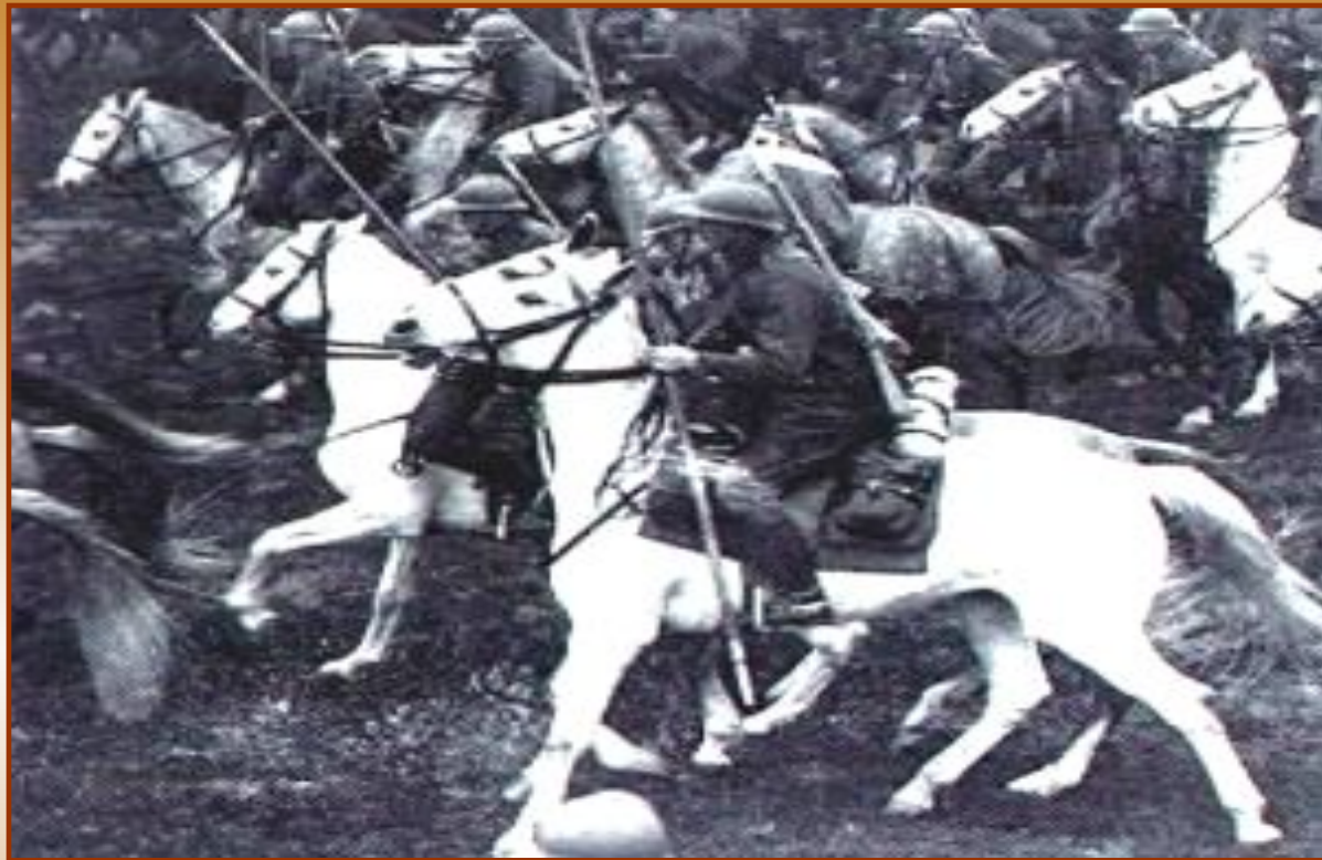
Атака польской кавалерии

Гитлер бросил против Польши 2/3 вооруженных сил, имевших абсолютное техническое превосходство.