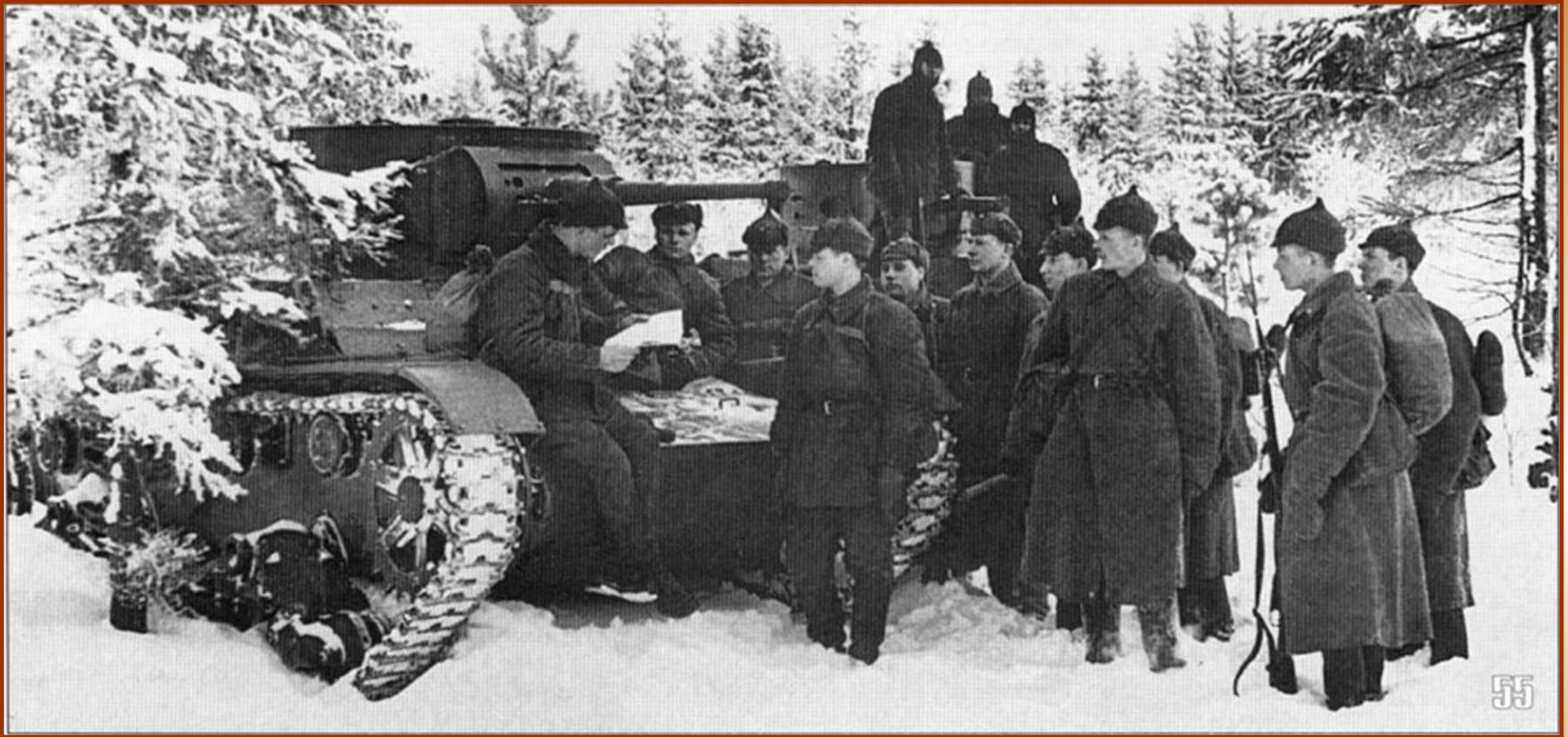
Советские солдаты в Финляндии

Советский союз начал территориальные захваты в «своей» зоне влияния. Война 1939-1940 гг. привела к территориальным уступкам со стороны Финляндии, но ей удалось сохранить независимость.