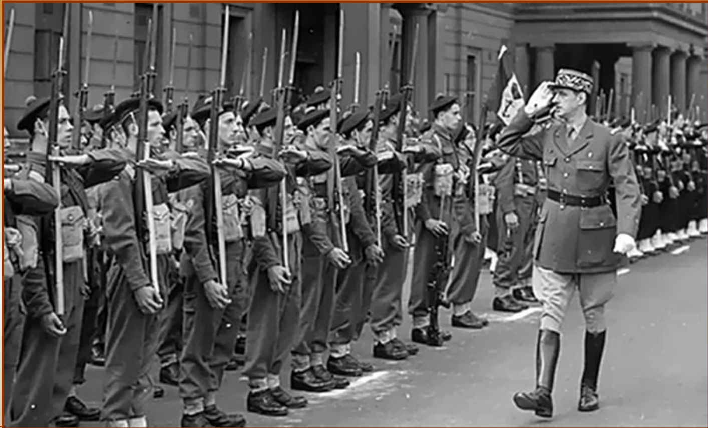
Генерал Шарль де Голль перед отрядами французских солдат, отправляющихся в Англию

Часть французских войск во главе с генералом Шарлем де Голлем отказалась сложить оружие и эвакуировалась в Англию, где совместно с союзниками продолжила борьбу против фашизма.