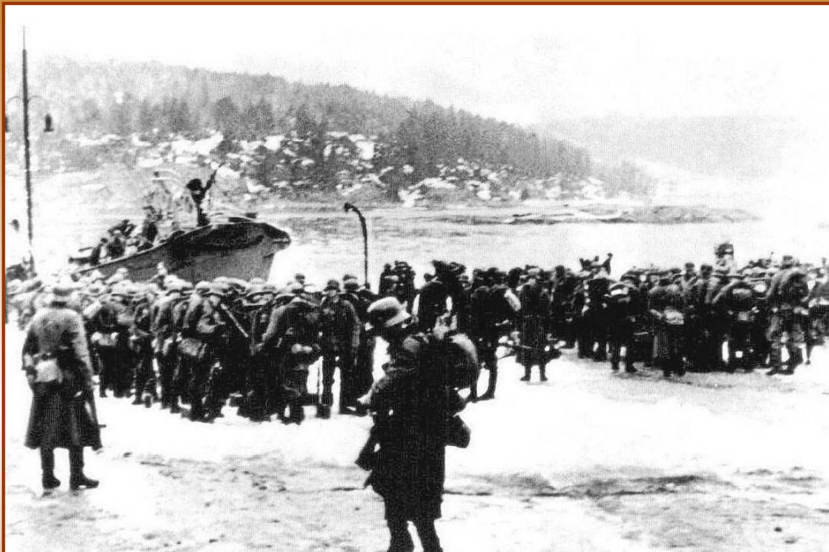
Высадка немецких войск в Норвегии

В апреле 1940 г. немцы вторглись в Данию и Норвегию. Дания сдалась без сопротивления. Норвежские войска оказали упорное сопротивление, но оставшись без поддержки своих союзников-англичан, были разгромлены, а страна оккупирована немцами.