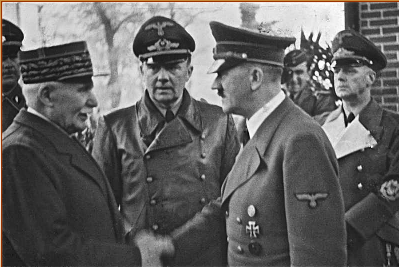
Гитлер и Петен

Маршал Петен в Компьенском лесу подписал перемирие по которому Франция разоружалась, ее север и запад оккупировался Германией. На юге Франции создавалось марионеточное государство во главе с Петеном (столица Виши).