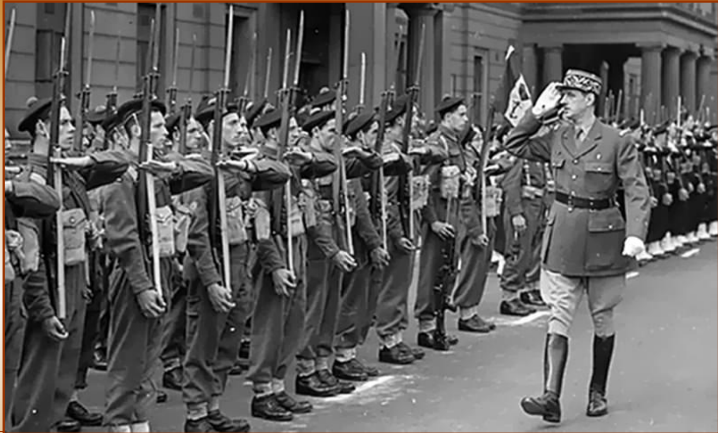
Генерал Шарль де Голль перед отрядами французских солдат, отправляющихся в Англию

Часть французских войск во главе с генералом Шарлем де Голлем отказалась сложить оружие и эвакуировалась в Англию, где совместно с союзниками продолжила борьбу против фашизма.