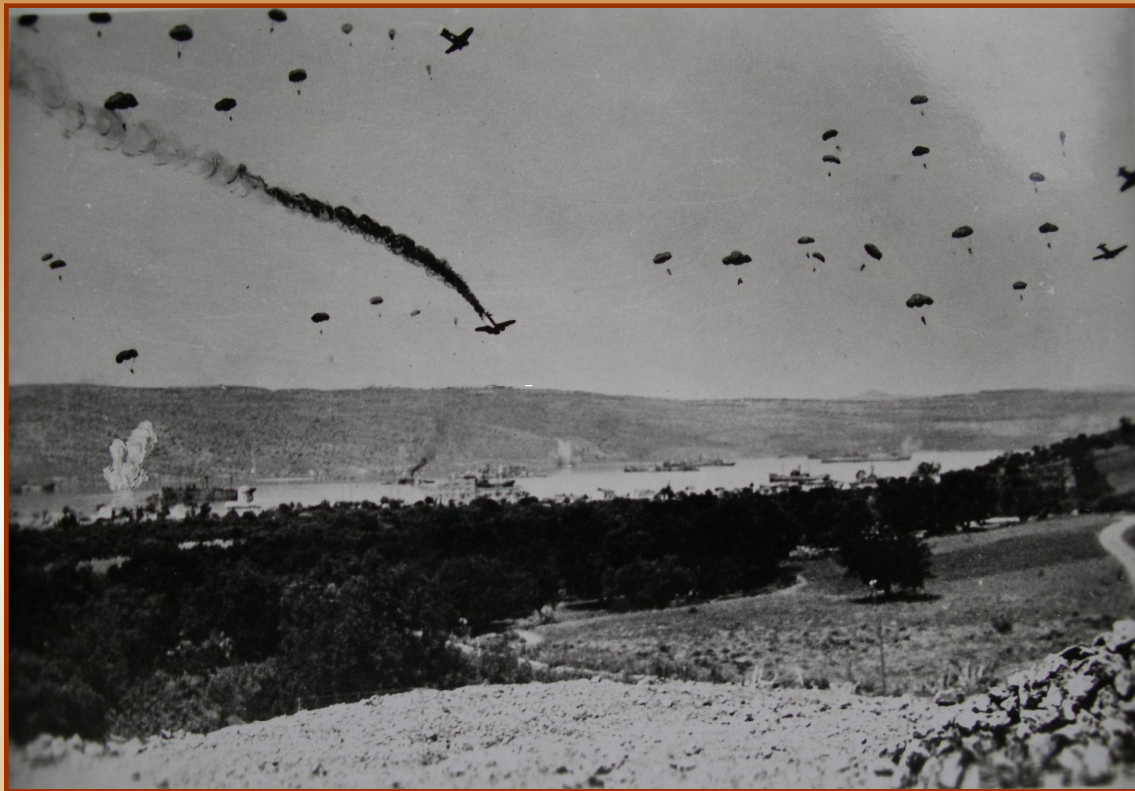
Немецкий десант на Крит

Англичане пытались создать плацдарм на Средиземном море на о.Крит. В конце мая, неожиданно для англичан, на остров был высажен воздушный десант немецких войск. Остров был захвачен.