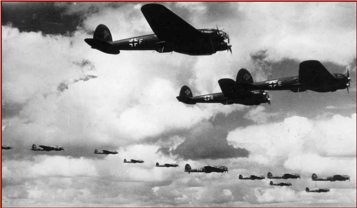
Немецкие самолеты над Англией