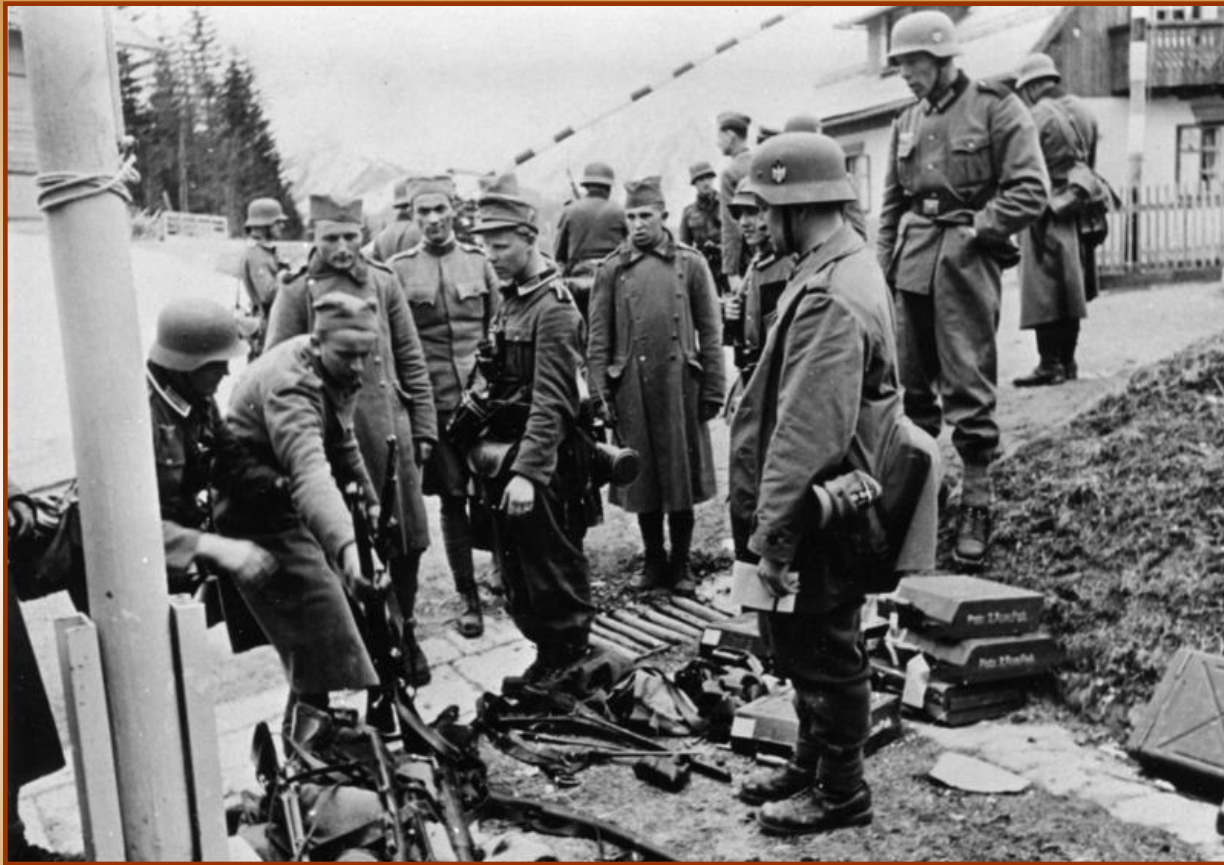
Югославские солдаты сдаются в плен

Италия вторглась в Грецию, но греки разбили врага. В апреле 1941 г. немецкие, итальянские, венгерские и болгарские войска вторглись в Грецию и Югославию. К концу апреля обе страны капитулировали.