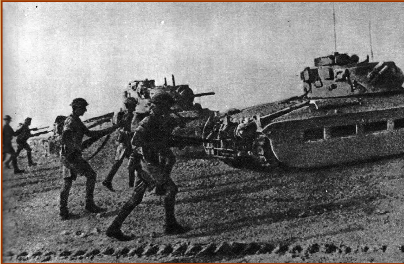
Английские солдаты в Африке

Германия и Италия попытались захватить Суэцкий канал, чтобы прервать связь Британии с колониями, но их войска завязли в боях на Ливийско-египетской границе.