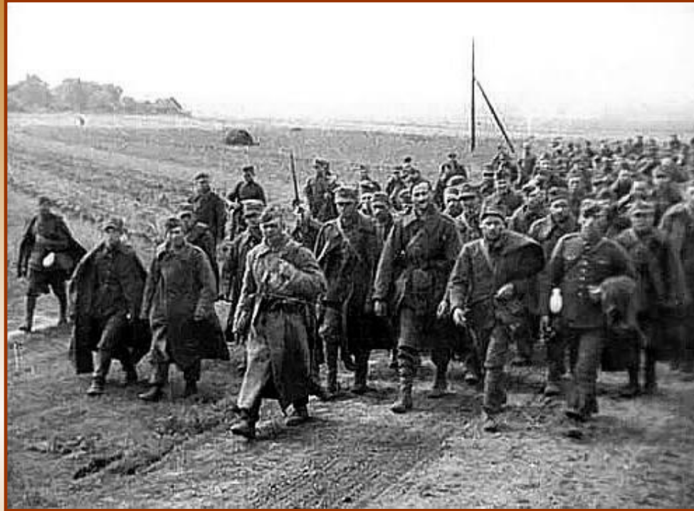
Пленные польские солдаты

17 сентября 1939 г. Сталин объявил «Мирный поход» по освобождению западных украинцев и белорусов.