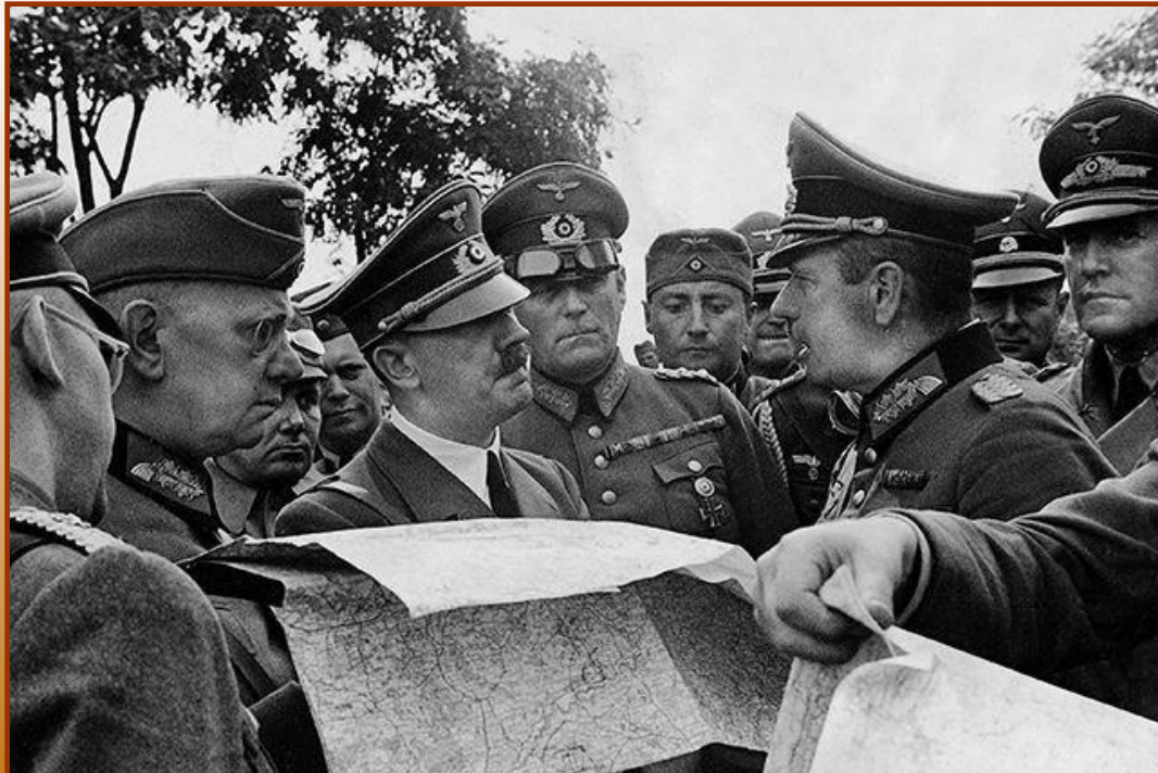
А.Гитлер инспектирует войска