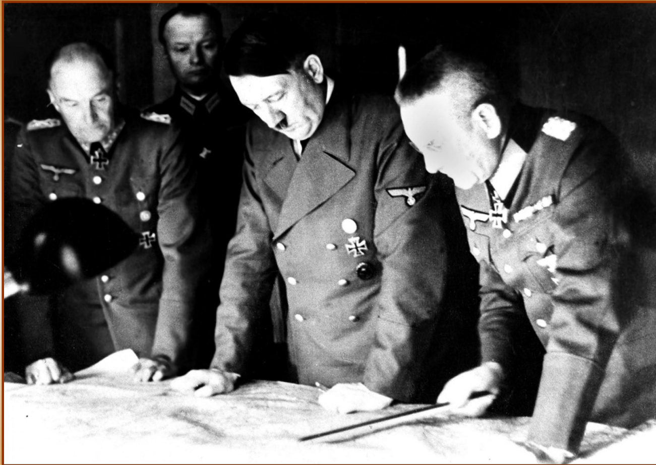
Гитлер над планом «Барбаросса»

Несовместимость интересов СССР и Германии вели их к неизбежному столкновению. В декабре 1940 г. Гитлер утвердил план нападения на СССР – «Барбаросса».