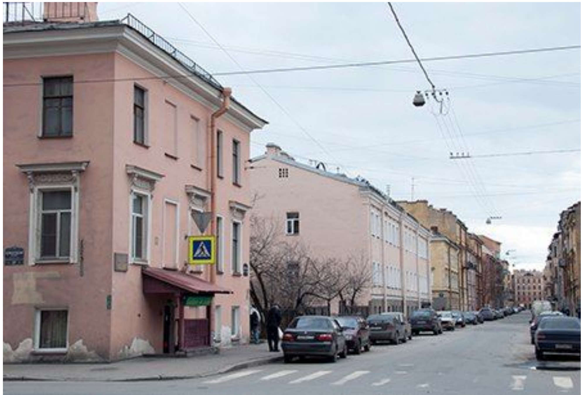
Улица Лабутина в Петербурге