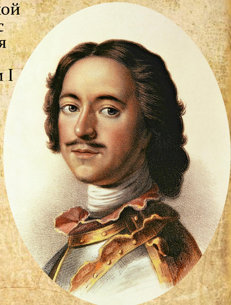
Пётр Первый (1672 – 1725 гг.)