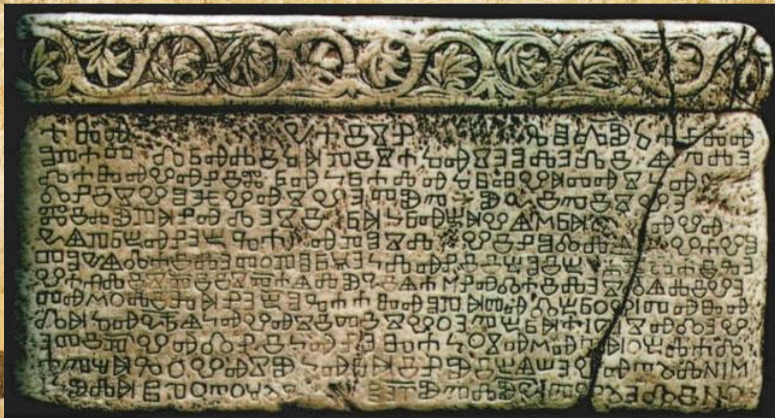
Башканская плита, XI век. Глаголица

Глаголица — древняя славянская азбука, создана славянским проповедником святым Константином (Кириллом) Философом и его братом Мефодием в 863 году по просьбе Моравского князя Ростислава, для записи церковных текстов на славянском языке.