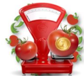
Конкурс "Минусинский чемпион"