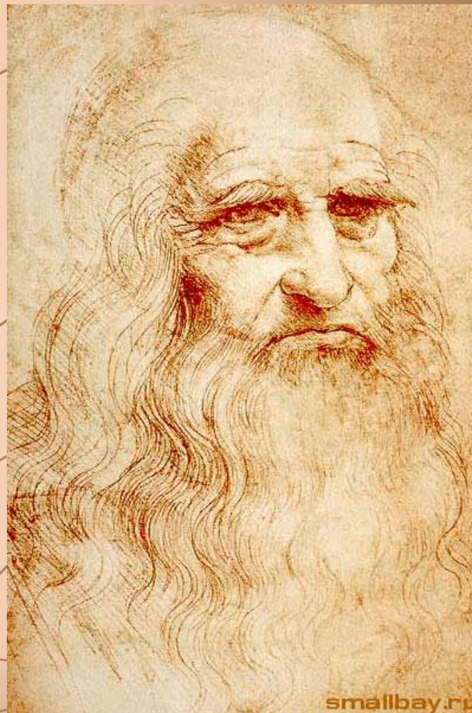
Автопортрет Леонардо да Винчи