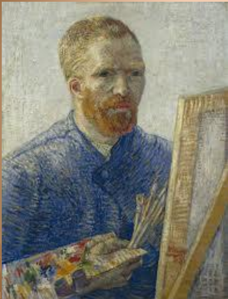
Автопортрет Винсента Ван Гога