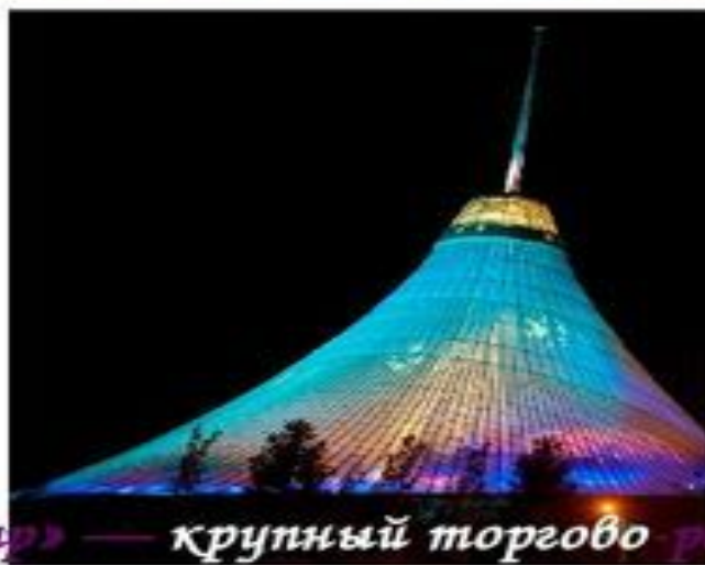
«Хан Шатыр» — крупный торгово-развлекательный центр