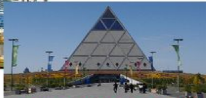
Дворец Мира и Согласия