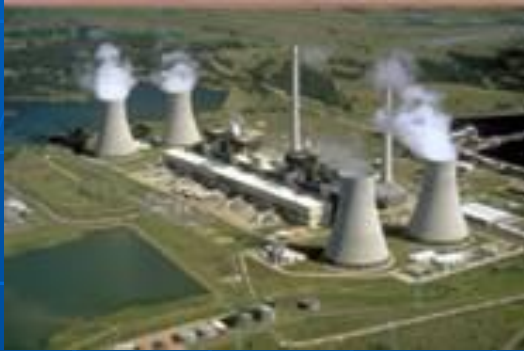
Промышленное загрязнение воздуха