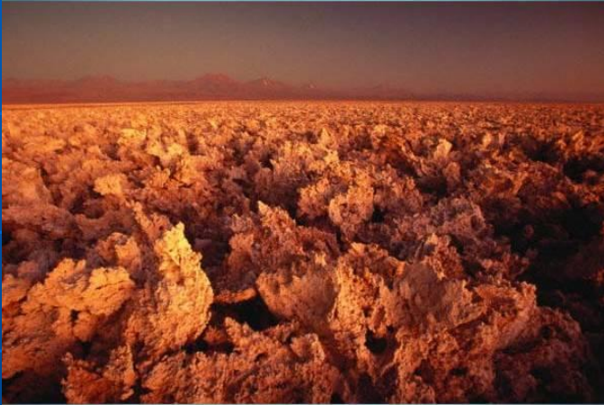
Соль в пустыне Чили