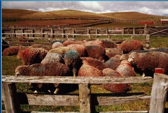
Овцеводство в Аргентине