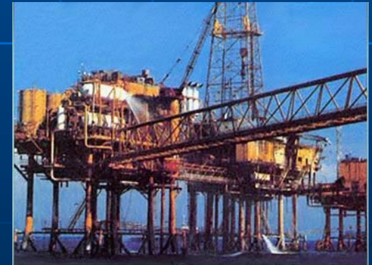
Добыча нефти в море