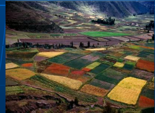
Поля в Эквадоре