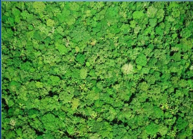
Кроны деревьев Вид с самолёта