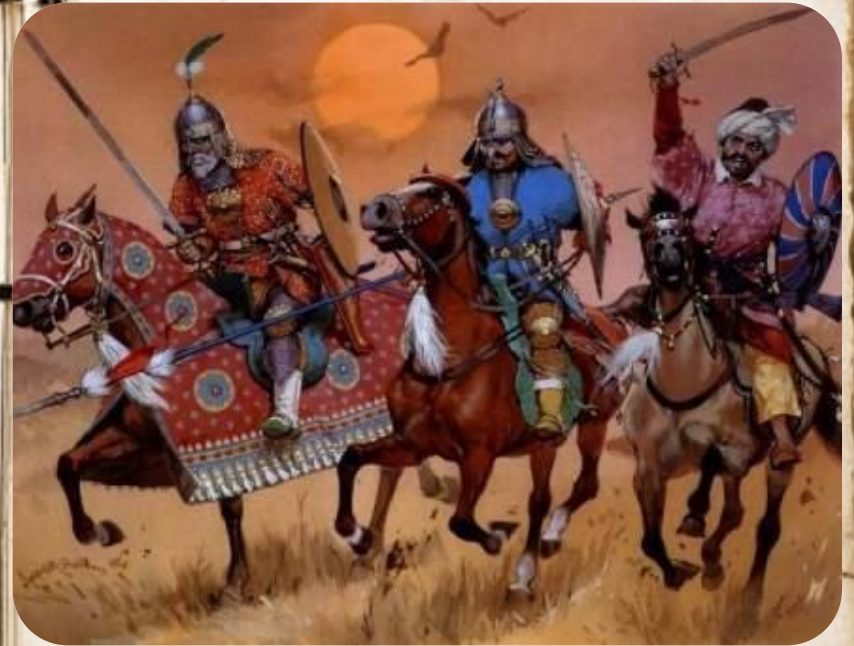
Правитель Орды хан Ахмат выступил в поход весной 1480 г.