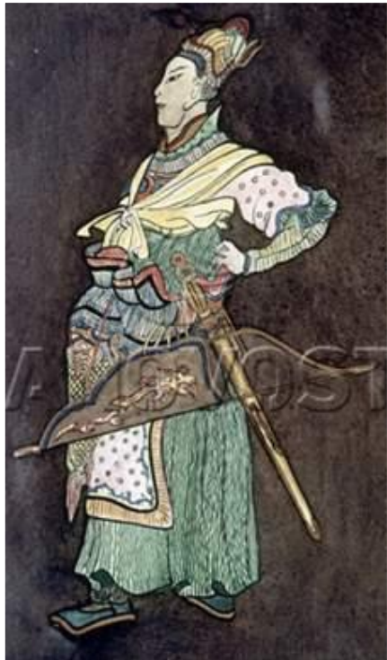
Ахмат Хан Большой Орды 1460 - 1481