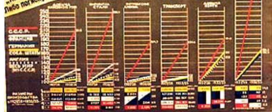
ТЕМПЫ РОСТА ПРОИЗВОДСТВА ЗА 5 ЛЕТ в СССР и в КАПИТАЛИСТИЧЕСКИХ СТРАНАХ

„Пятилетний план развития народного хозяйства СССР обеспечивает такие темпы прироста, какие невозможны и недоступны уже капитализму. По темпу своего развития наша промышленность войдет, наша сельскохозяйственная продукция в особенности, обогнать и перегнать развитие капиталистических стран“