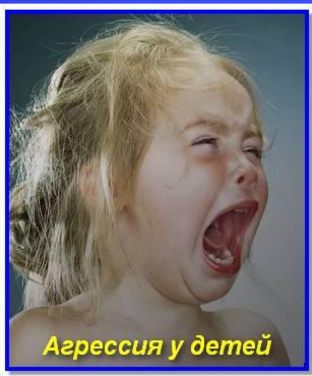
Агрессия у детей