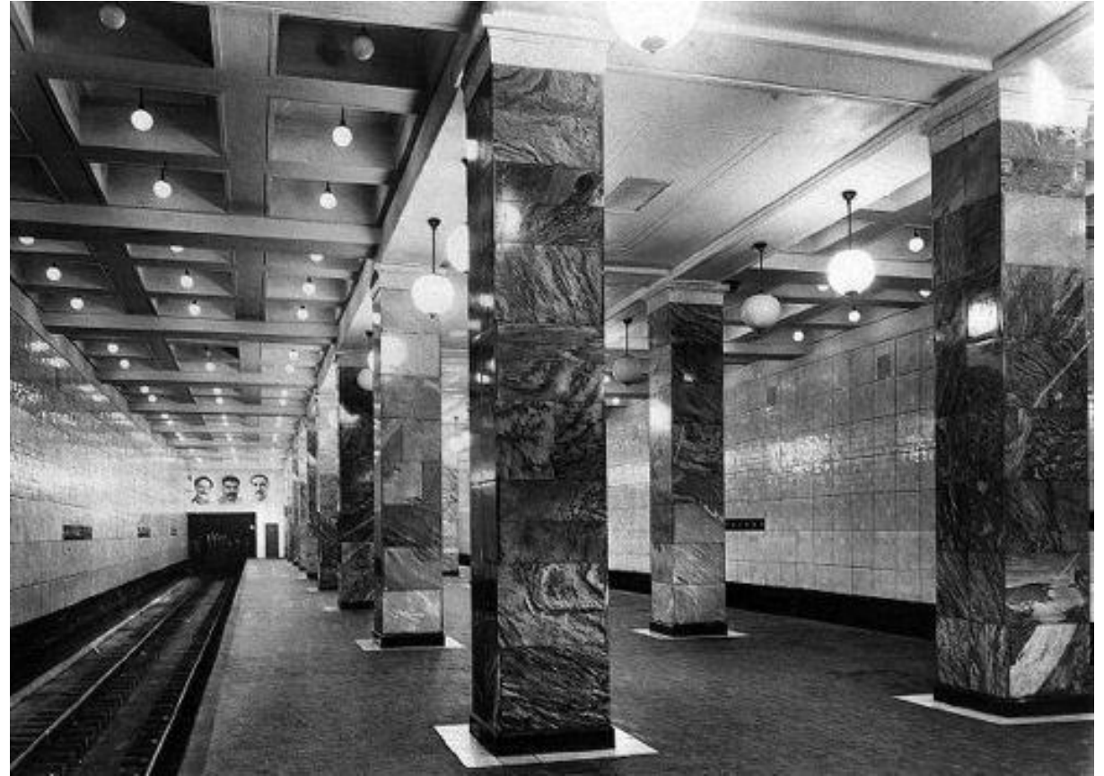
Станция Сокольники, 1935 г. Портреты Орджоникидзе С., Сталин И., Каганович Л.