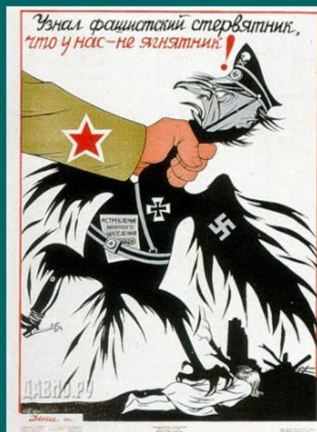
Дени «Немецкий стервятник»

Карикатура – это сатирический или юмористический рисунок