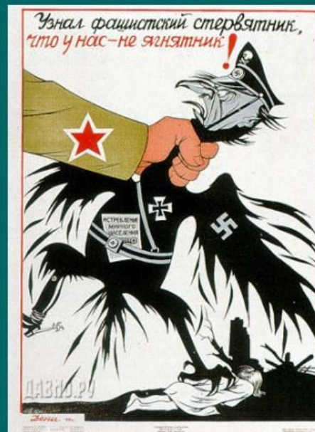
Дени «Немецкий стервятник»

Карикатура – это сатирический или юмористический рисунок