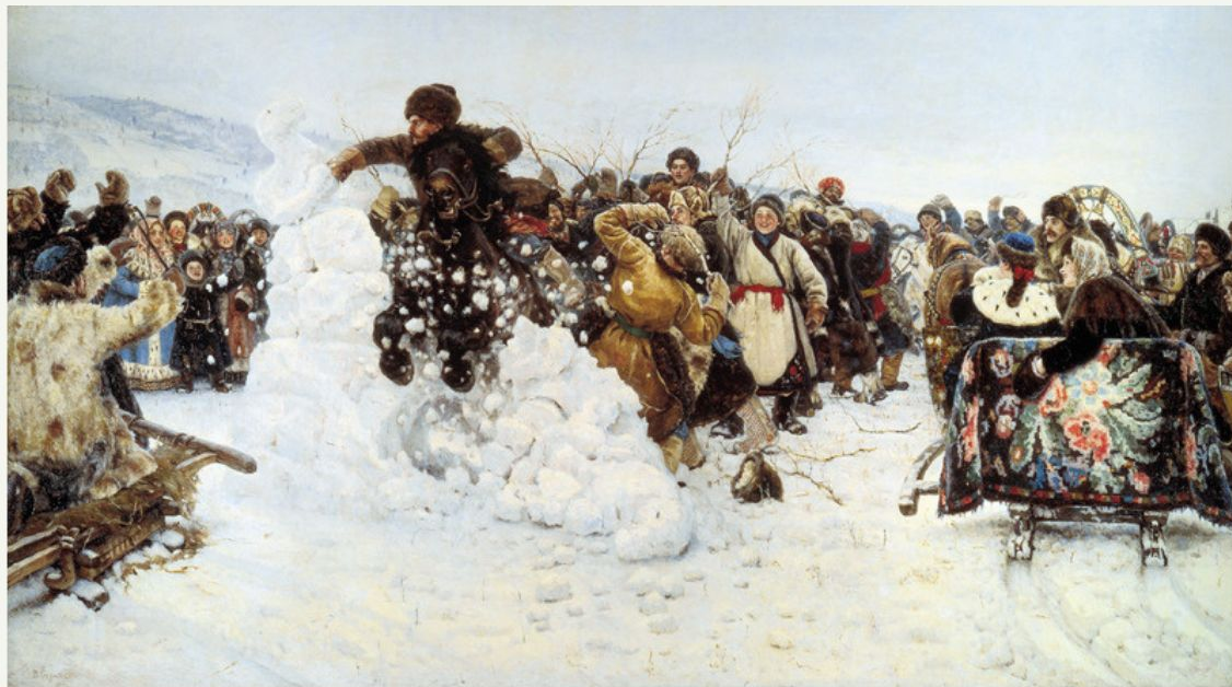
В. Суриков «Взятие снежного городка»