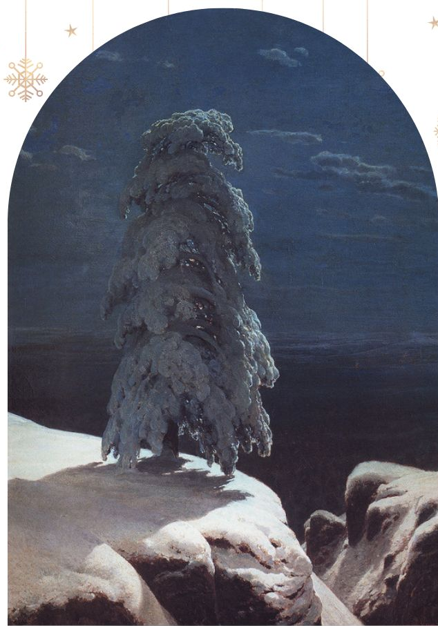
И. Шишкин «На севере диком»

И снится ей все, что в пустыне далекой, В том крае, где солнца восход, Одна и грустна на утесе горючем Прекрасная пальма растет