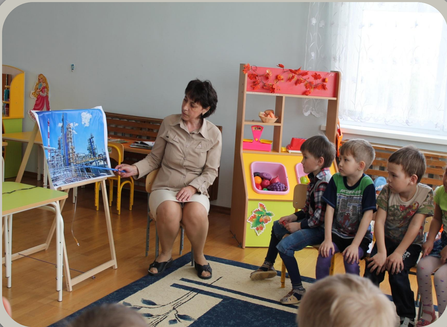
Движение нефти по трубам на завод