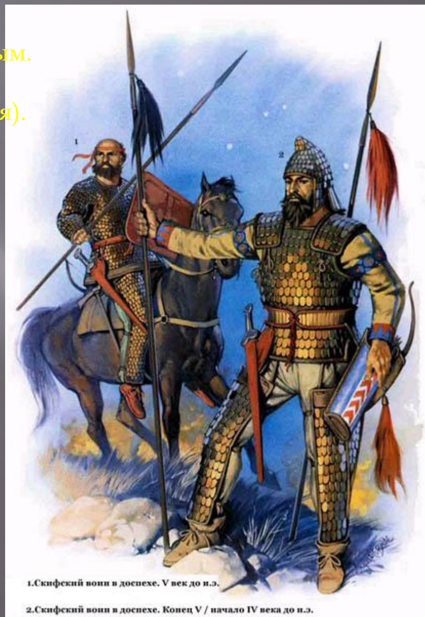
1. Скифский воин в доспехе. V век до н.э.