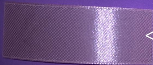
<- 2,5 см * 7 см