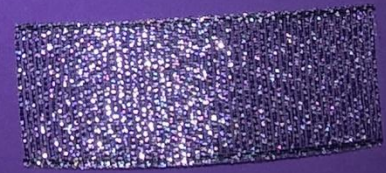
<- 2 см * 6 см