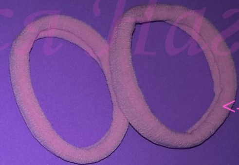
<- Резиночки 2 шт