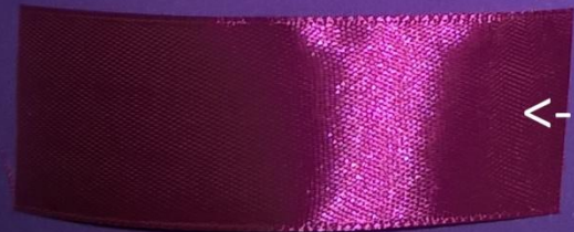
<- 2,5 см * 7 см