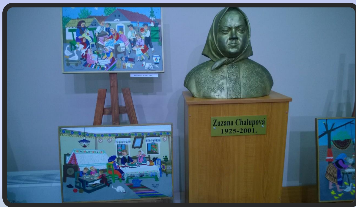
Galerija naivne umetnosti u Kovačici