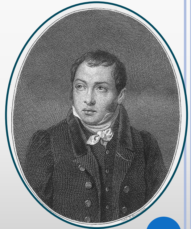
Аскаков Константин Сергеевич