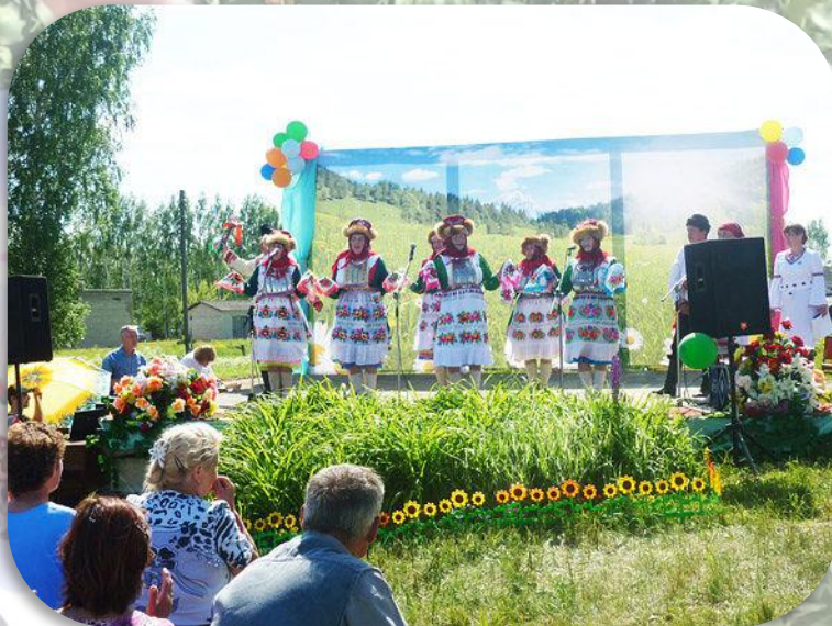
Выступления самодеятельных артистов

Национальная кухня: домашний квас (пура), хлебцы (эгерче), блины, лепешки, перемечи, пироги из ягод и грибов, ватрушки, а также сырки (туара)