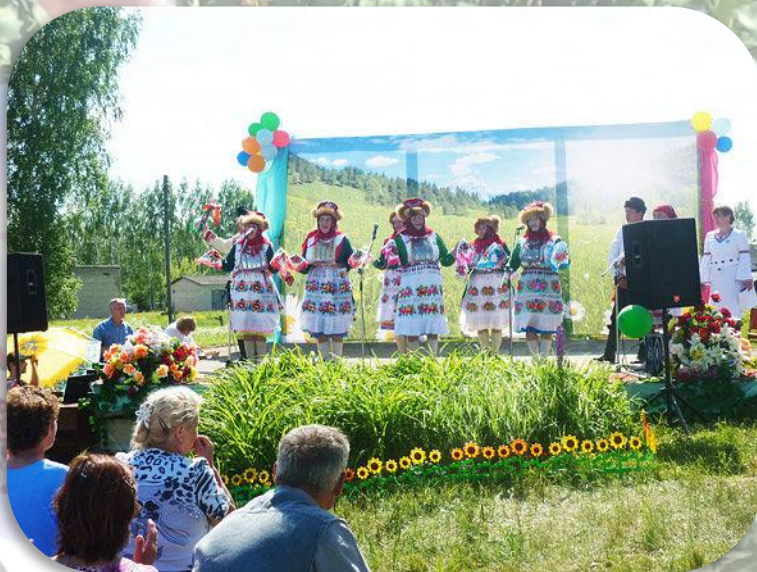
Выступления самодеятельных артистов

Национальная кухня: домашний квас (пура), хлебцы (эгерче), блины, лепешки, перемечи, пироги из ягод и грибов, ватрушки, а также сырки (туара)