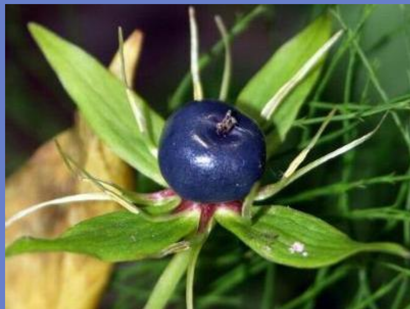
čūskoga вороний глаз