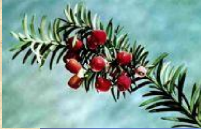
ogū īve ТИС ЯГОДНЫЙ