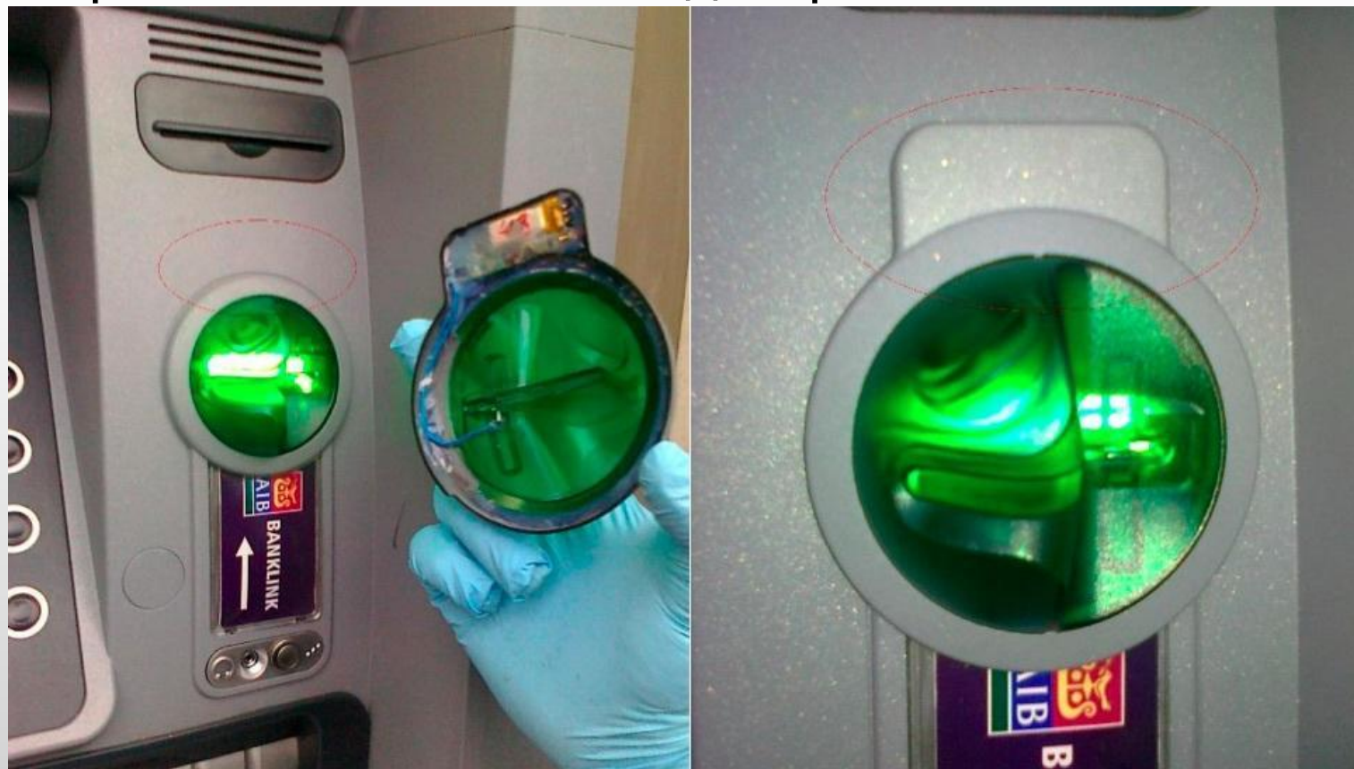
Самые распространенные скиммеры

Внешний вид и тип работы скимминговых устройств весьма различны. Они постоянно «эволюционируют» и «маскируются» под детали банкоматов, терминалов и внешнего декора.