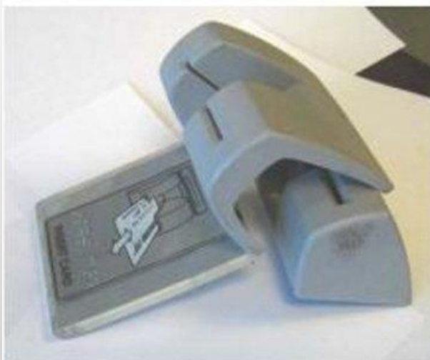
The capture device