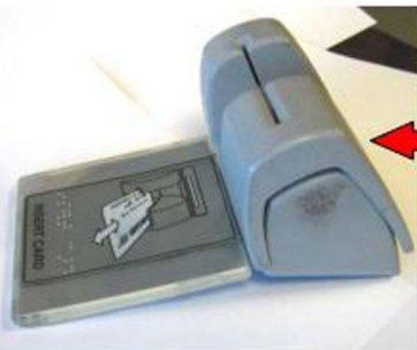
The side cut out is not visible when on the ATM.