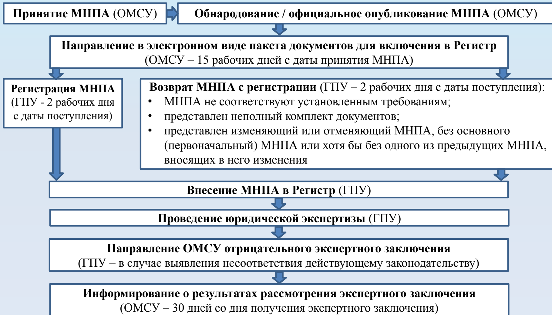
Схема ведения регистра МНПА