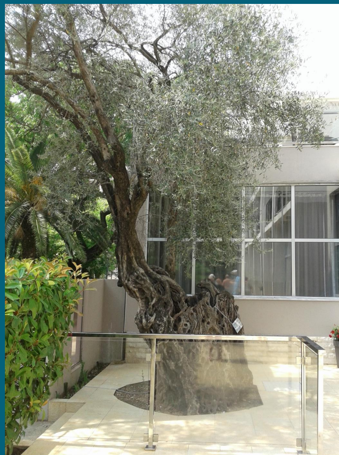
700 – летняя маслина в Черногории