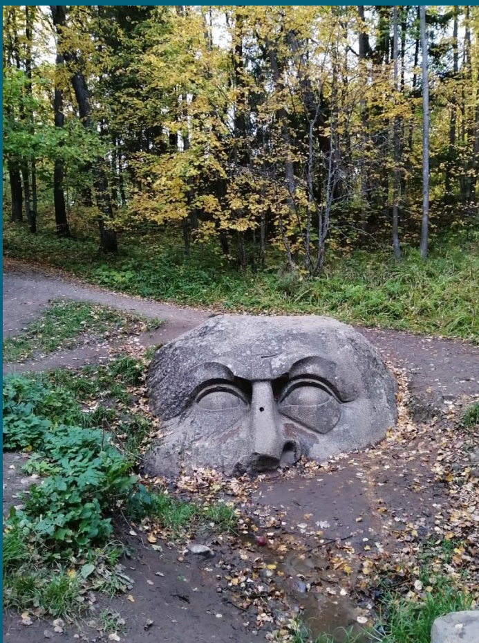
Валун в парке «Сергеевка» Старый Петергоф

Памятники природы – это достопримечательные природные объекты, подлежащие охране: водопад, пещера, роща редких деревьев, уникальное дерево.