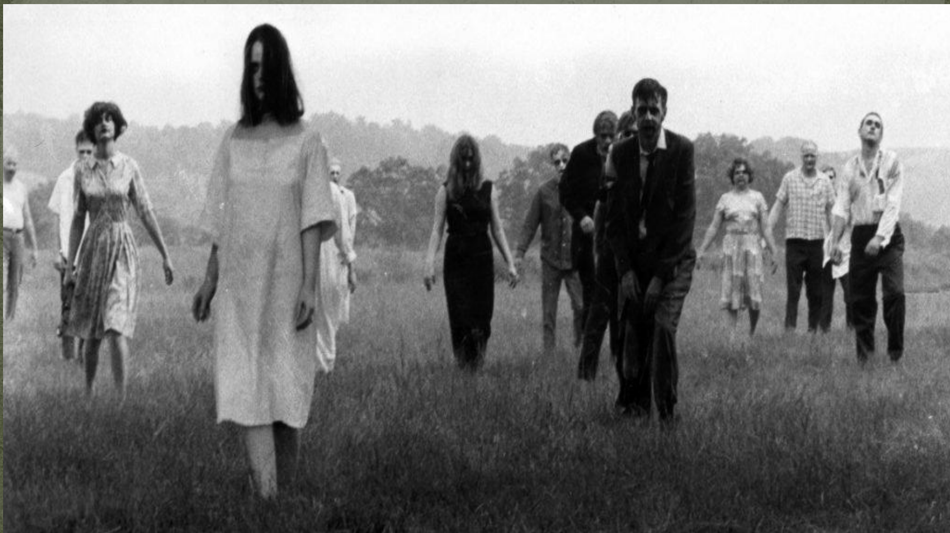
к/ф “Ночь живых мертвецов” (реж. Джордж Ромеро, 1968г)