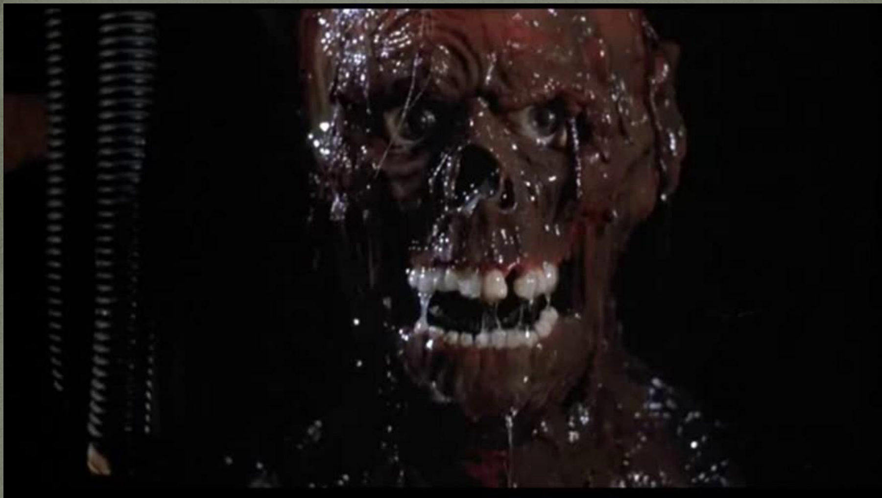
к/ф “Возвращение живых мертвецов” (реж Дэн О’Бэннон, 1985г)