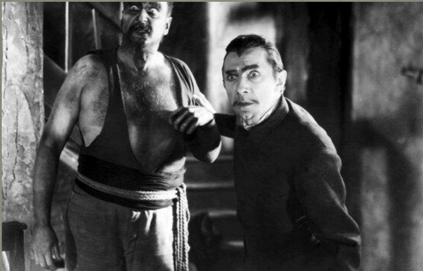
к/ф “Белый зомби” (реж. Виктор Гальперин, 1932г)