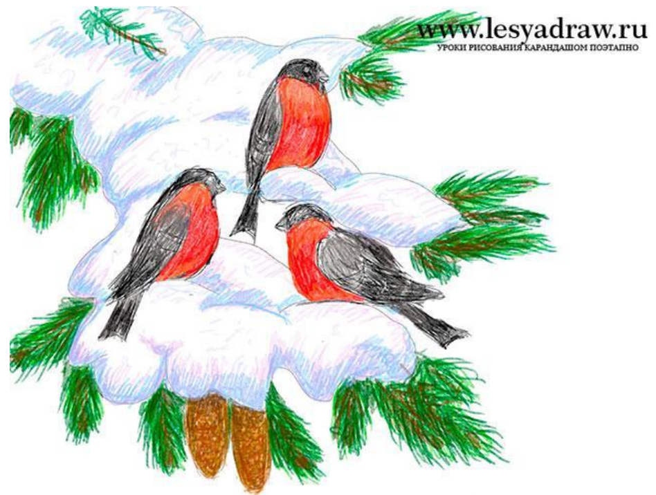
Рисунок «Снегири на еловой ветке»