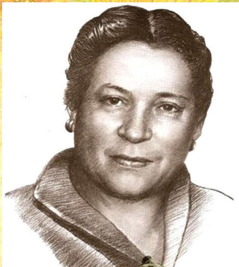
Агния Львовна Барто 1906-1981