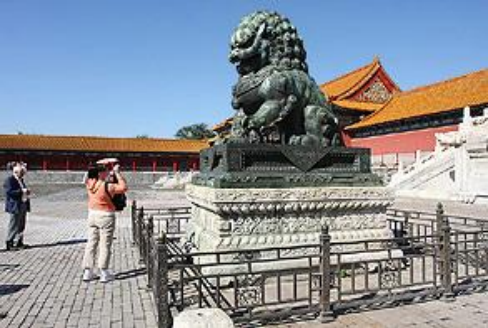
Бронзовые львы, охраняющие Ворота Высшей гармонии