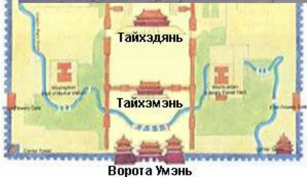
Зал Высшей гармонии (Тайхедянь)