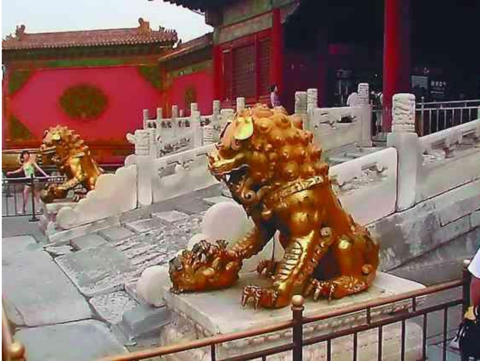
Золотые львы перед Воротами Небесной чистоты