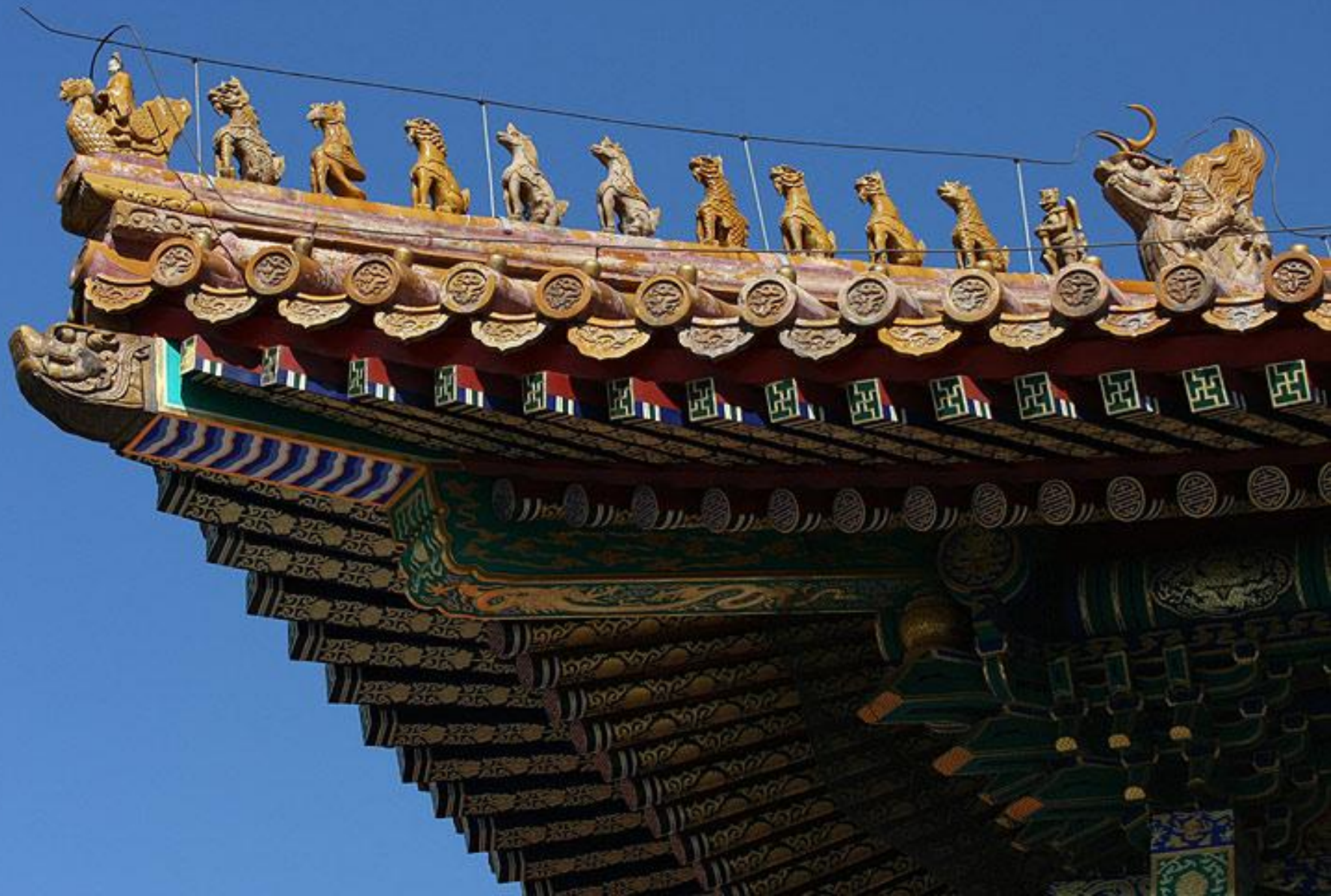
Крыша Зала Высшей гармонии