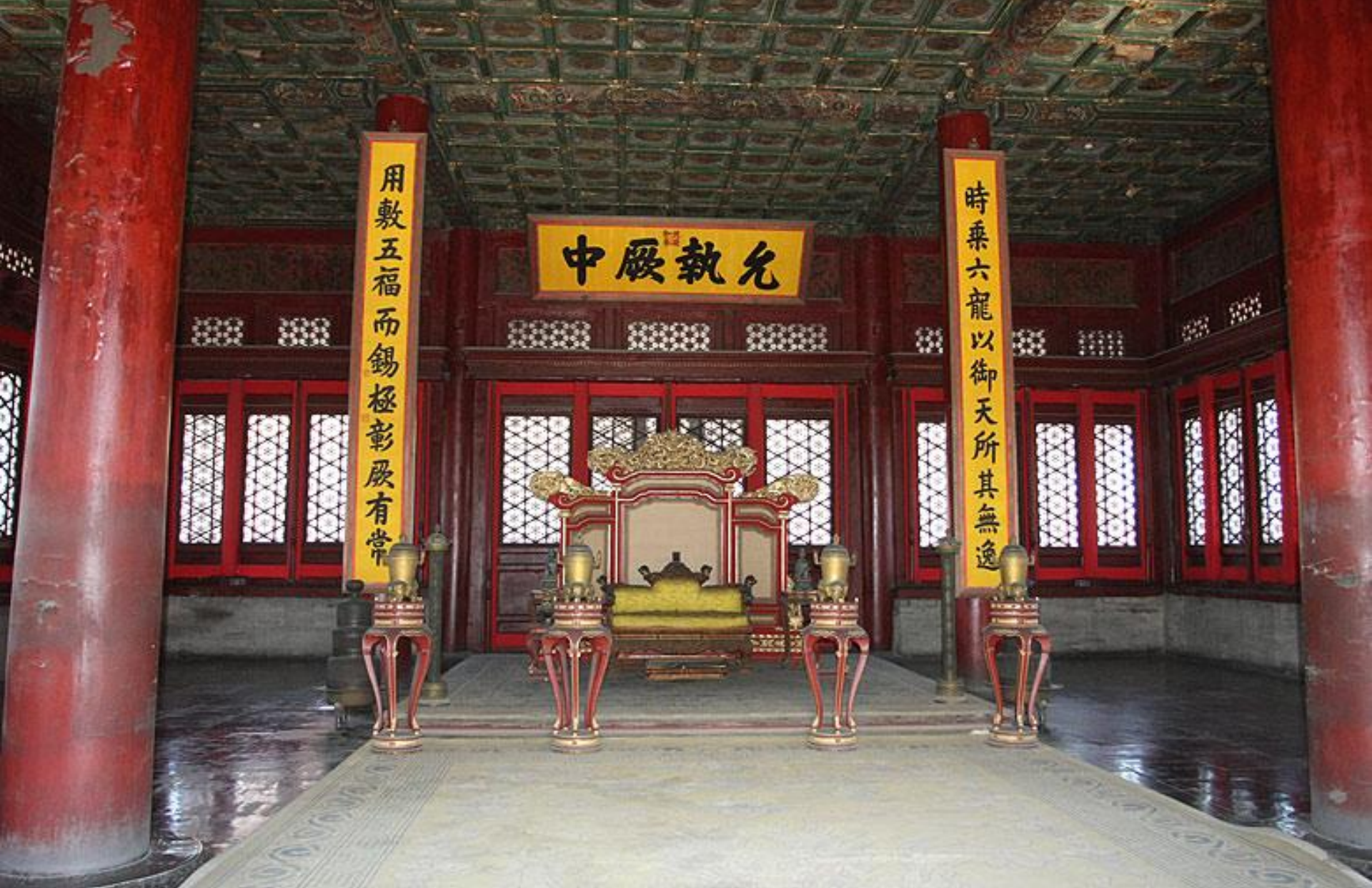
Трон в зале Центральной гармонии