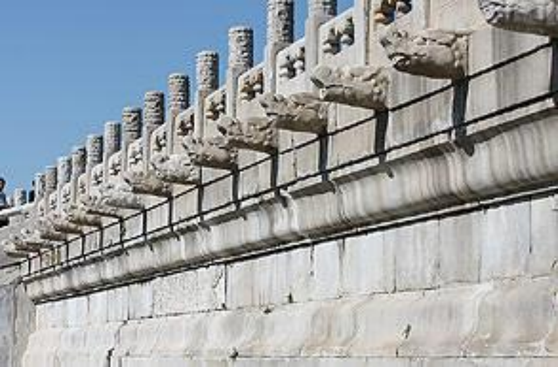
Водосливы в виде голов драконов