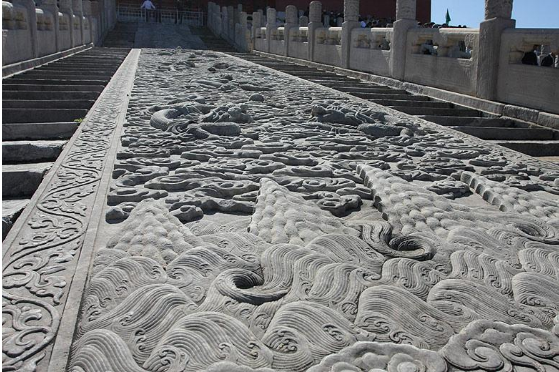
Большая каменная резьба позади Зала Сохраненной гармонии