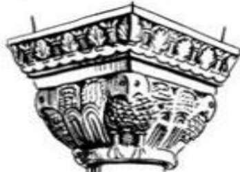
Капитель с изображением фигур животных