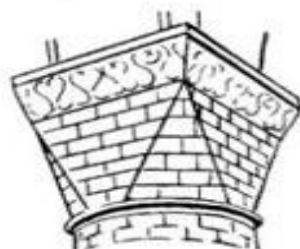
Кирпичная кубическая капитель