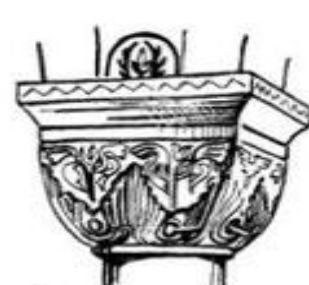
Капитель с гальметтами