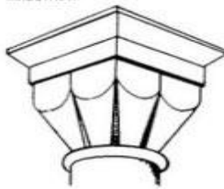
Капитель в виде трубок или складок