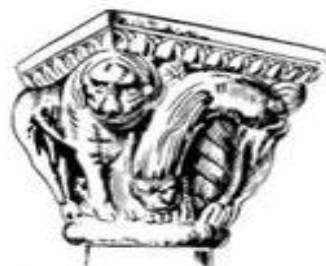
Капитель с изображением диких зверей, чудовищ