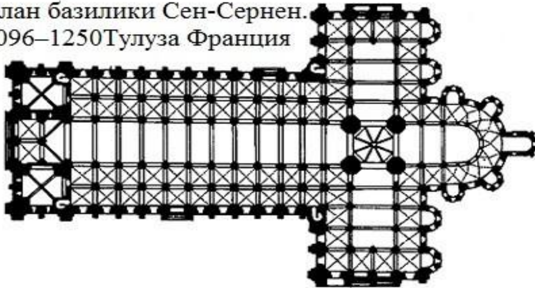
План базилики Сен-Сернен. 1096–1250 Тулуза Франция