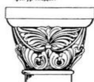
Чашевидная блочная капитель