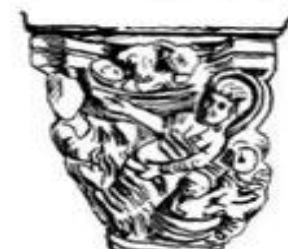
Капитель с изображением фигур людей