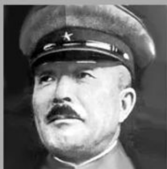
Итагаки Сэйсиро (1885-1948) Генерал японской армии. Обвинен в совершении военных преступлений. Казнен 23 декабря 1948 г.

Подобный процесс над японскими военными преступниками прошел и в Токио 3 мая 1946 – 12 ноября 1948 года.