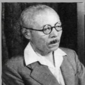
Кимура Хэйтаро (1888-1948) Генерал японской армии. Обвинен в совершении военных преступлений. Казнен 23 декабря 1948 г.