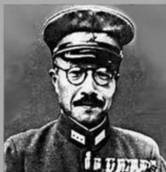
Тодзио Хидэки (1883-1948) Генерал. Политик. Обвинен в совершении военных преступлений. Казнен 23 декабря 1948 г.