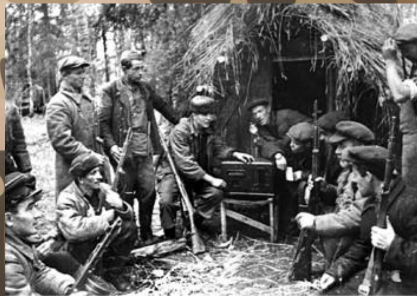
Новгородские партизаны в 1941 г.