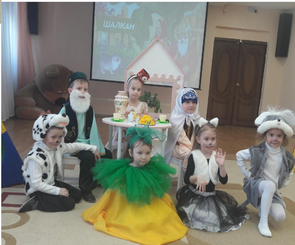
Творчество Габдуллы Тукая