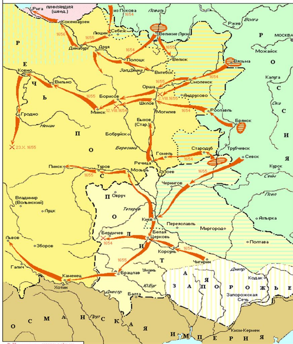
РУССКО - ПОЛЬСКАЯ ВОЙНА 1654 - 1667 гг.

В 1654 г. началась война России с Речью Посполитой. В 1667 г. согласно Андрусовскому перемирию Левобережная Украина присоединялась к России, а Правобережная оставалась под контролем Речи Посполитой.