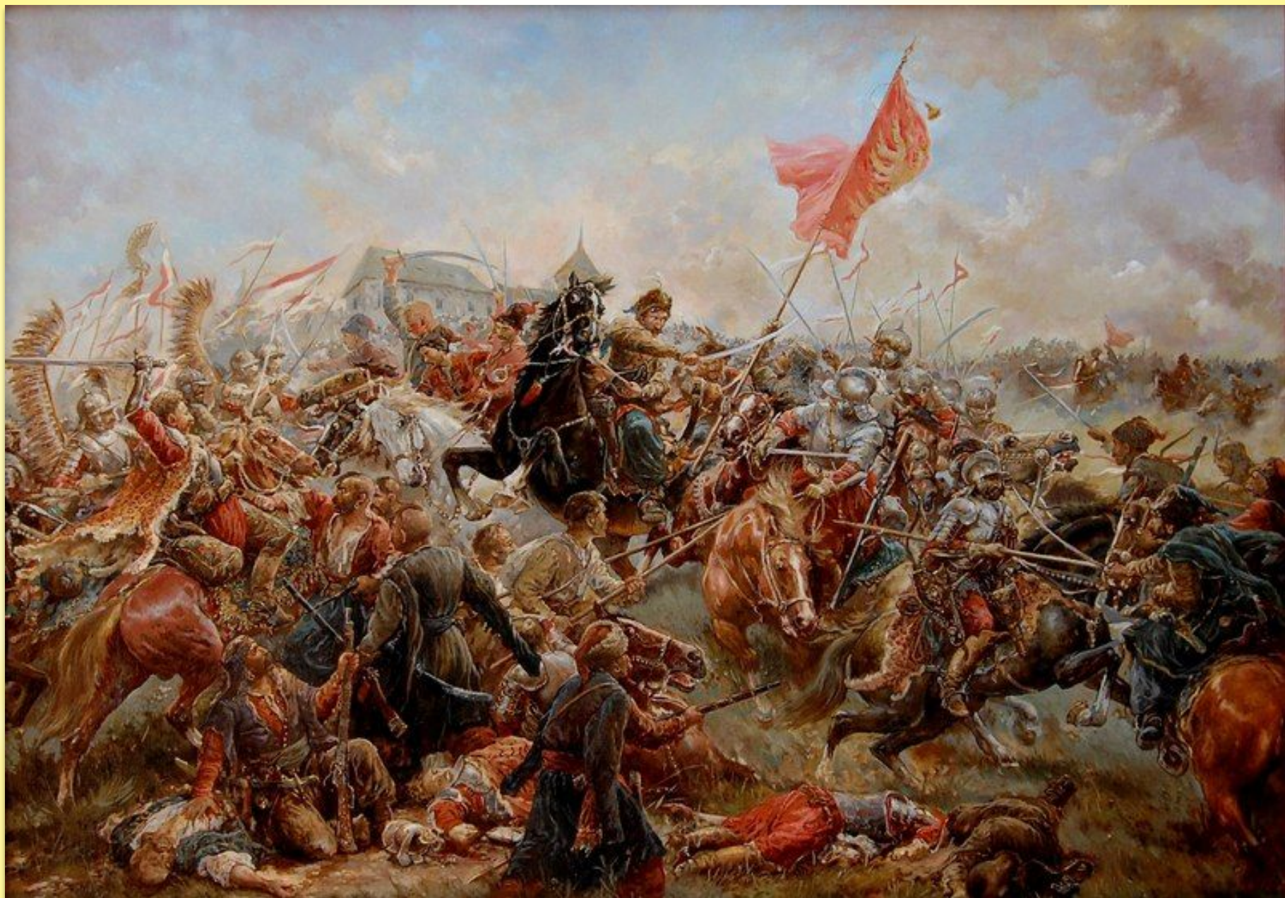
Битва под Пилявцами 1648г.