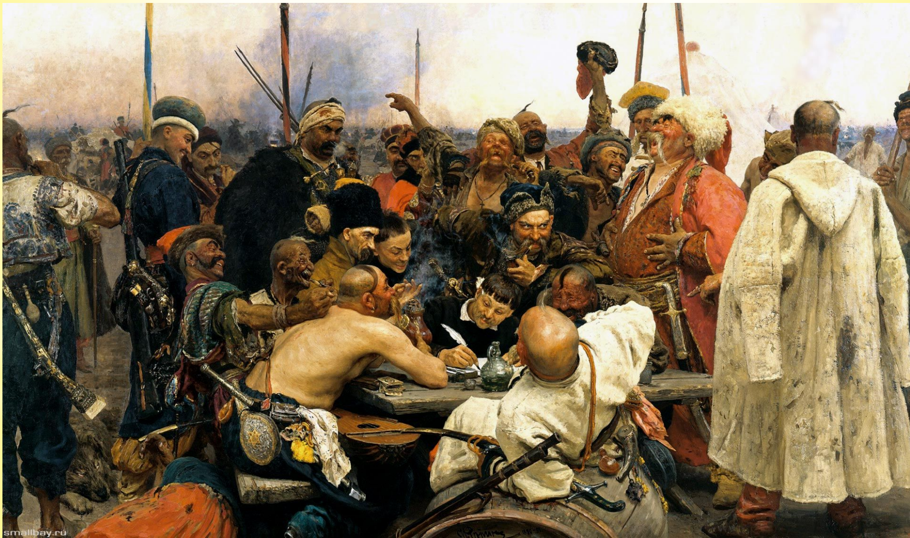
Репин И.Е. «Запорожцы пишут письмо турецкому султану».