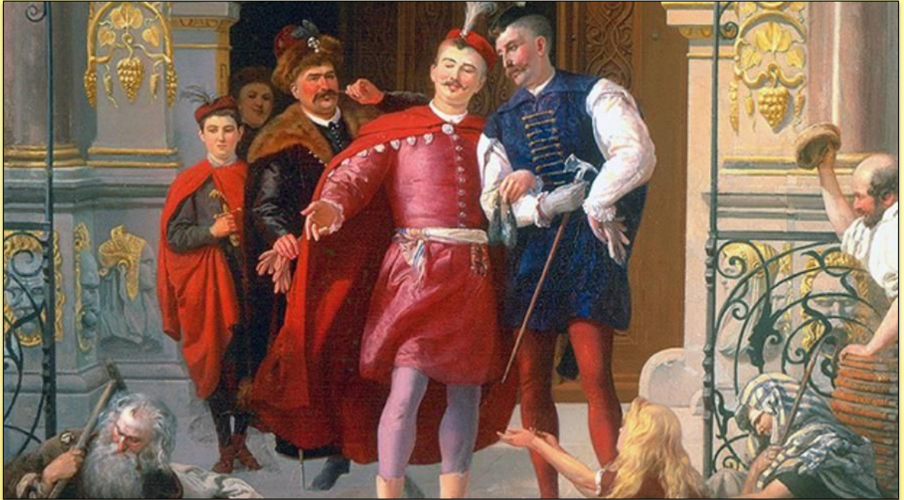
Вильгельм Штриовский Польская шляхта