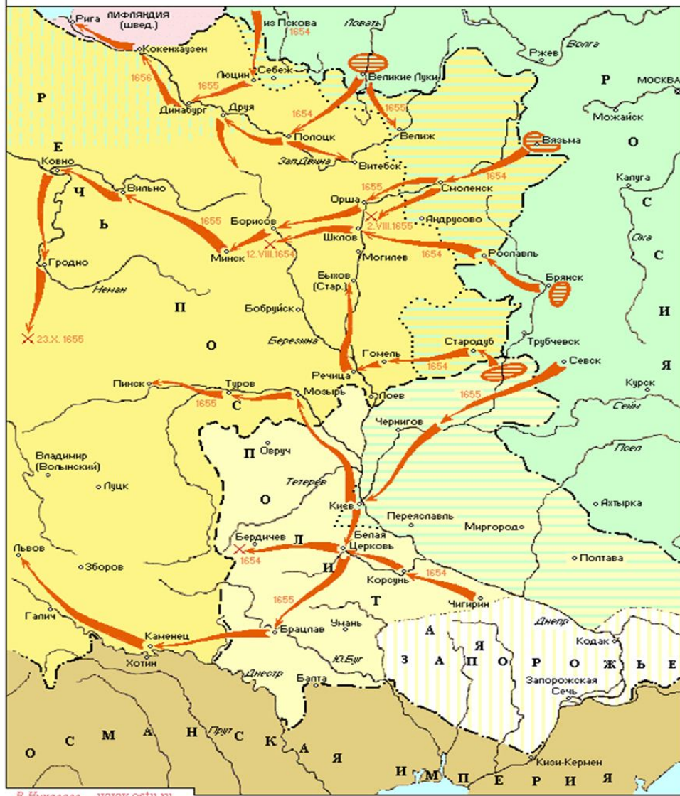
РУССКО - ПОЛЬСКАЯ ВОЙНА 1654 - 1667 гг.

В 1654 г. началась война России с Речью Посполитой. В 1667 г. согласно Андрусовскому перемирию Левобережная Украина присоединялась к России, а Правобережная оставалась под контролем Речи Посполитой.