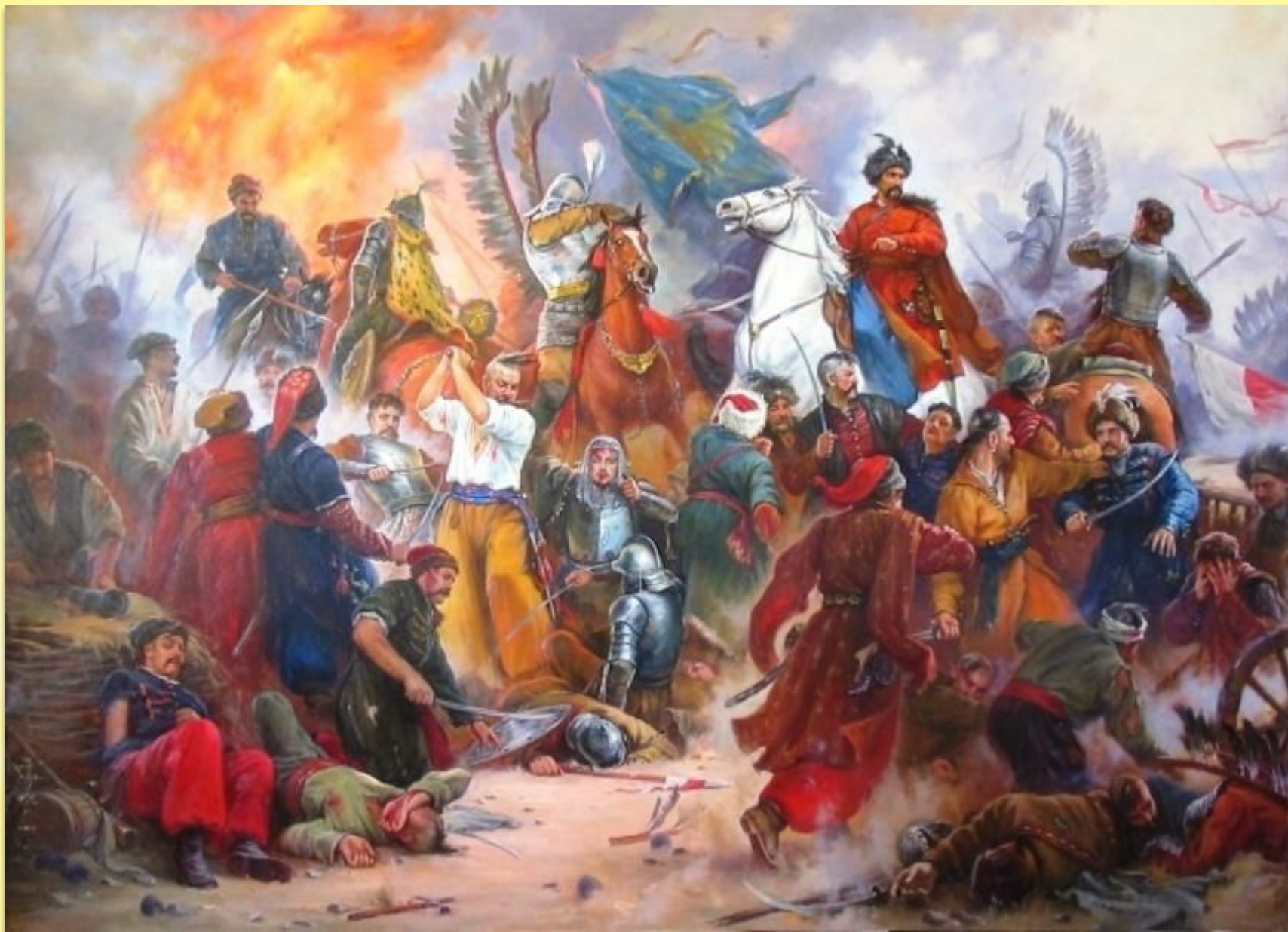
Битва под Берестечком 1651г.