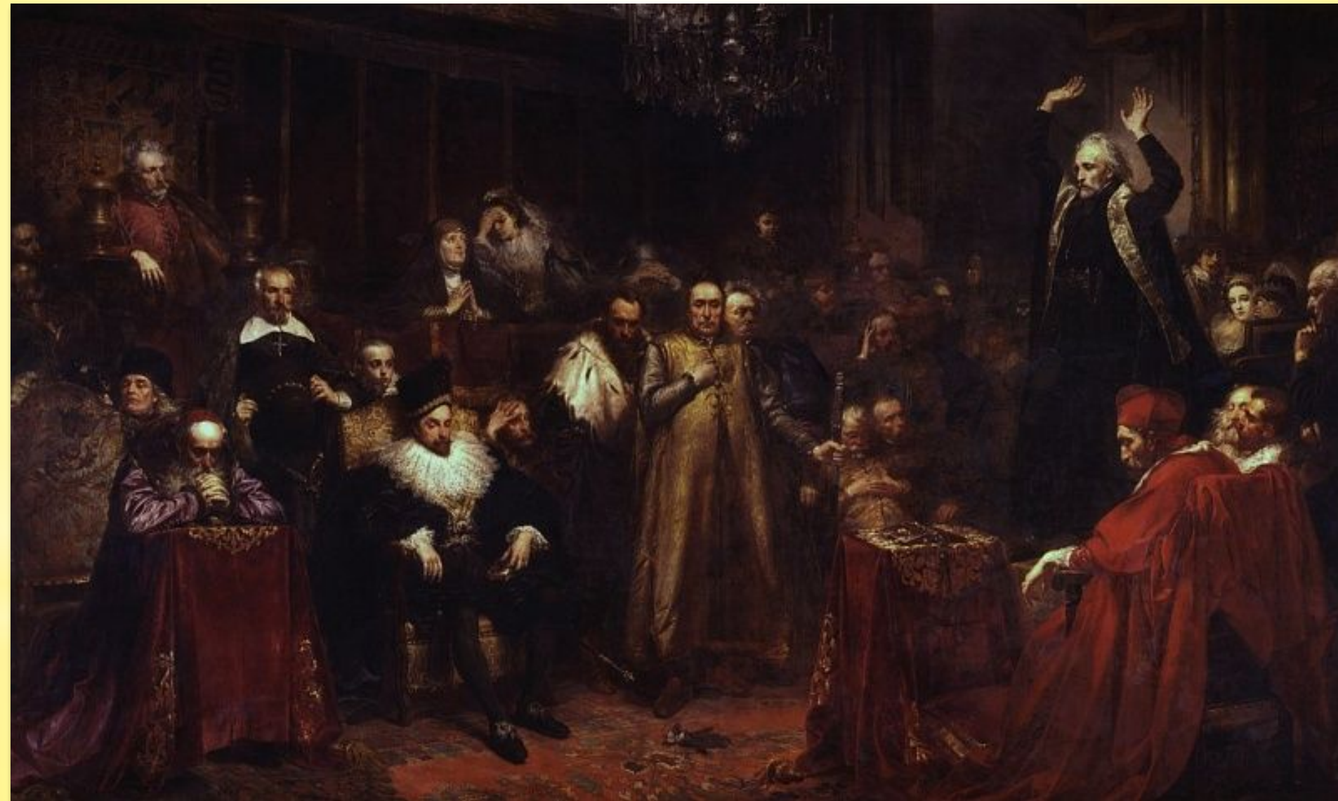
Ян Матейко Проповедь Скарги