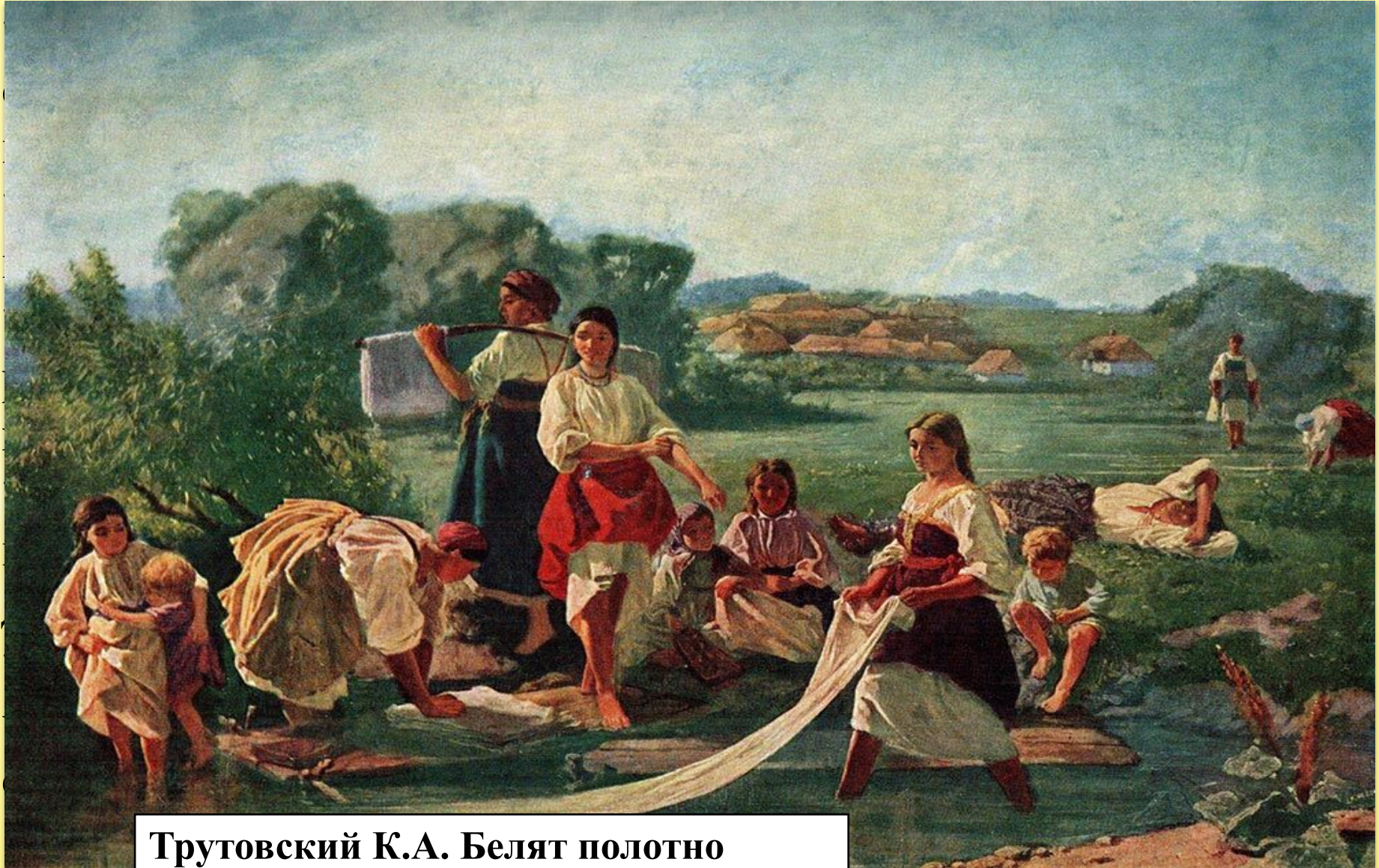
Трутовский К.А. Белят полотно