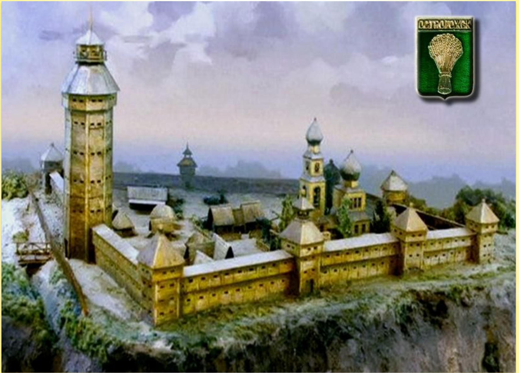
Острогжская крепость 17в.