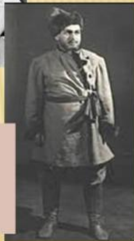
Сабинин , жених Антониды (тенор) – характер удальи