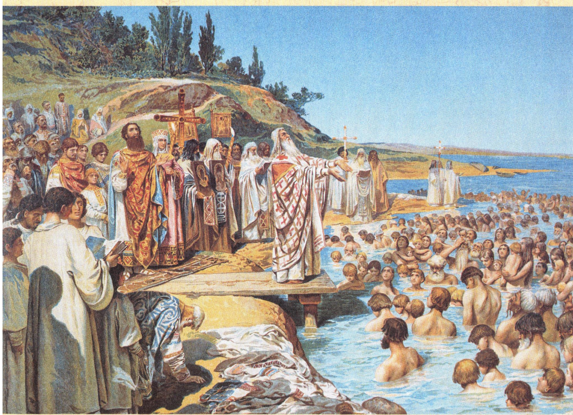
Крещение киевлян произошло довольно легко и быстро. Иначе было в Новгороде и других городах на севере — там еще долго волхвы мучили народ. С. Лебедев. «Крещение киевлян».