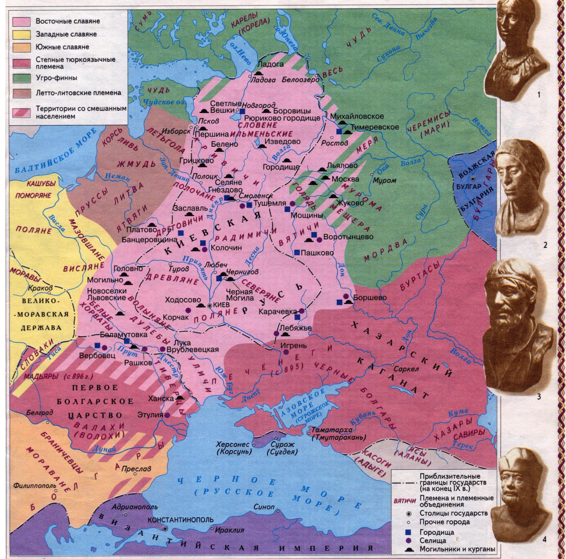
Славяне и их соседи в VII—IX вв.

Славяне жили племенными союзами (этап на пути складывания государственности.)