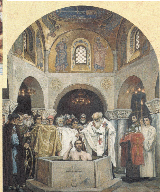
Князь Владимир крестился в Корсуни, а уже потом крестил киевлян. В. Васнецов. «Крещение князя Владимира». Роспись во Владимирском соборе. Киев