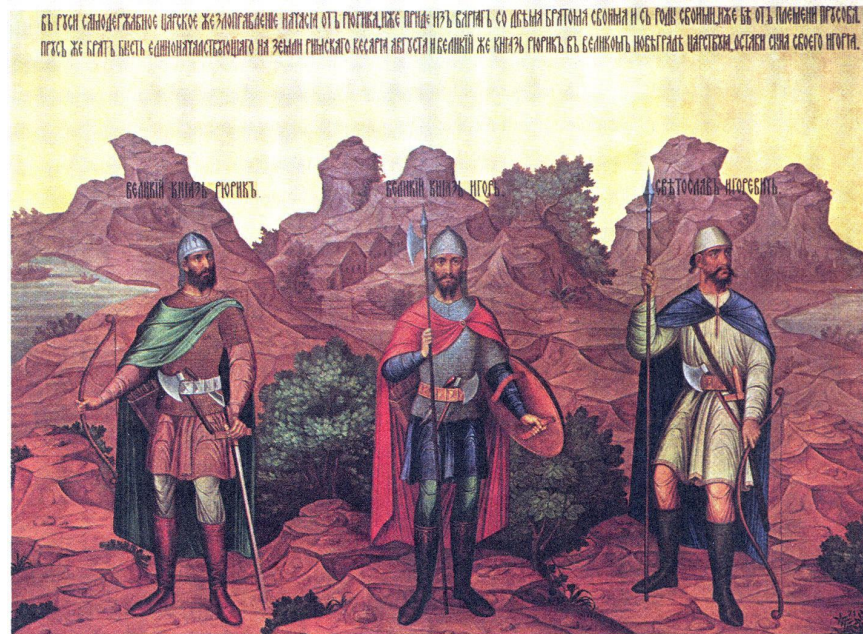
На иконе три первых князя династии: Рюрик, Игорь, Святослав. Они изображены русами, а не скандинавами или германцами