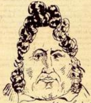
Le Croquis ressemble à Louis Philippe, vous condamneriez donc?

Si, pour reconnaître le monarque dans une caricature, vous n'attendez pas qu'il soit désigné autrement que par la ressemblance, vous tomberez dans l'absurde. Voyez ces croquis informes, sur quels j'aurais tant été et dû former ma défense.