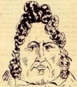
Ce Croquis ressemble à Louis Philippe, vous condamneriez donc?

Si, pour reconnaître le monarque dans une caricature, vous n'attendez pas qu'il soit désigné autrement que par la ressemblance, vous tomberez dans l'absurde. Voyez ces croquis informes, sur quels j'aurais tant aimé de voir tomber ma défense.