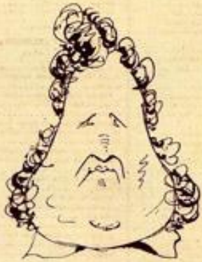
Puis condamner pour cet autre qui ressemble au second...