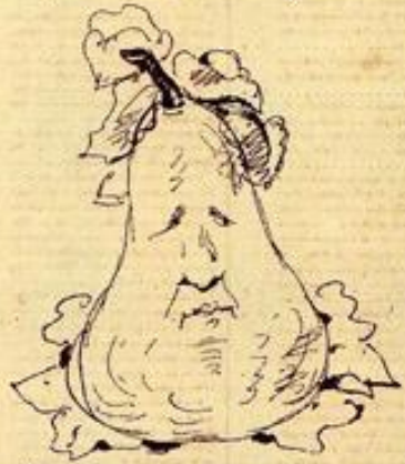
Et enfin, si vous êtes Croquis, vous ne devriez absoudre cette poire qui ressemble aux Croquis privés.

Où, pour une poire, pour une brioche, et pour toutes les têtes grotesques dans les quelles le hasard ou la malice aura placé cette toute ressemblance, vous pourriez infliger à l'autre cinq ans de prison et cinq mille francs d'amende!!