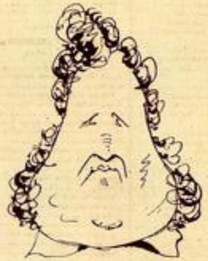
Puis condamner pour cet autre qui ressemble au second...