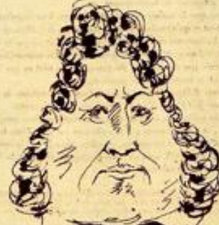
Mais, si j'aurais condamné celui-ci qui ressemble au Président.