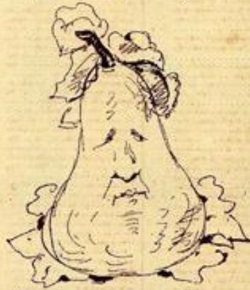
Et enfin, si vous êtes Convaincus, vous ne sauriez absoudre celui-ci qui ressemble au Croquis privé.

Où, pour une poire, pour une brioche, et pour toutes les têtes grotesques dans les quelles le hasard ou la malice aura placé cette toute ressemblance, vous pourriez infliger à l'autre cinq ans de prison et cinq mille francs d'amende!!