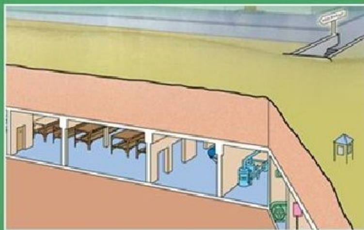
ОТДЕЛЬНО СТОЯЩЕЕ УБЕЖИЩЕ