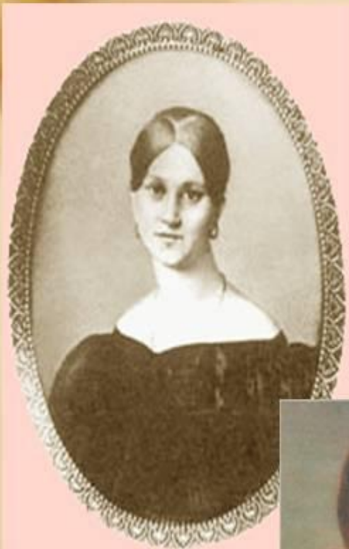
Керн Анна Петровна (1800-1879)