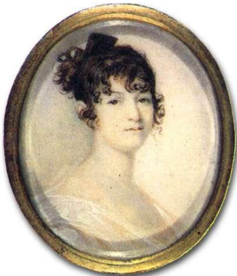
Надежда Осиповна Ганнибал