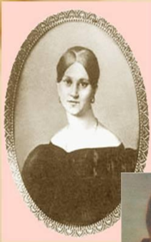
Керн Анна Петровна (1800-1879)