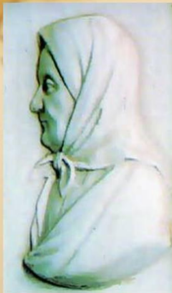
Барельеф Арины Радионовны работы по кости Я.П. Серякова 1840-е г.г.

В этот период его жизнь протекала довольно спокойно, была насыщена только прогулками и новыми знакомствами. Также это время было временем усиленного творчества и усиленных изучений. Он занимался современной историей.