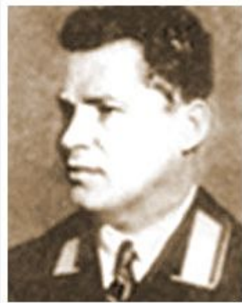
Константин Петрович Горшенин