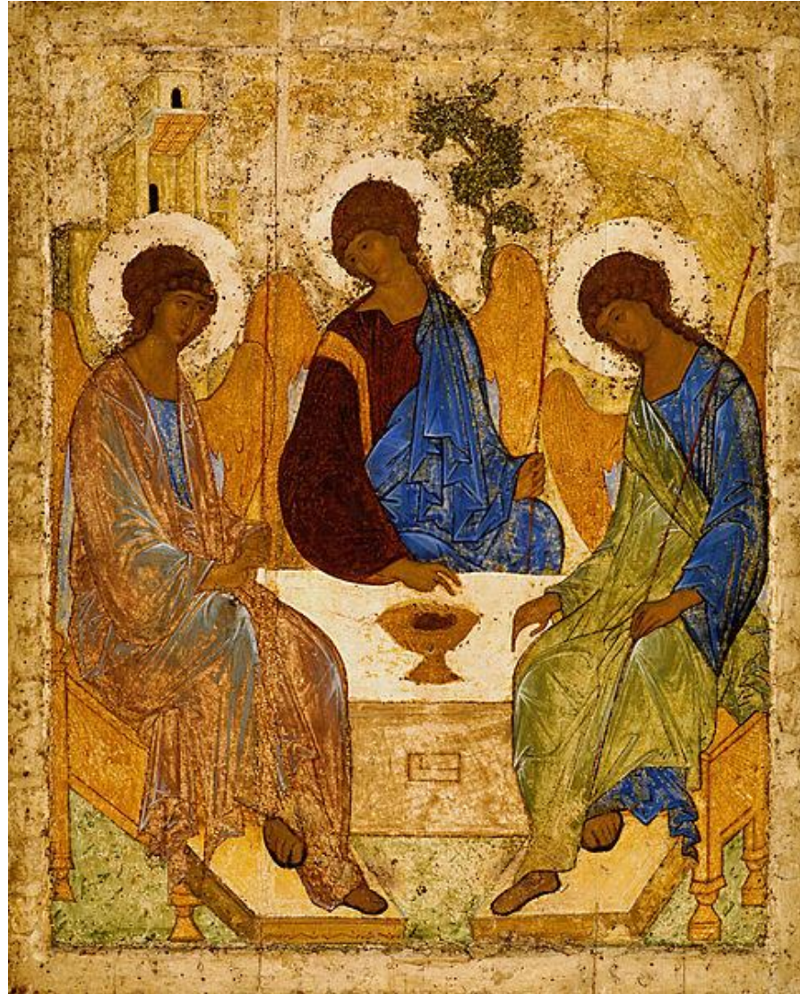
Икона Троица. Андрей Рублёв. XV век