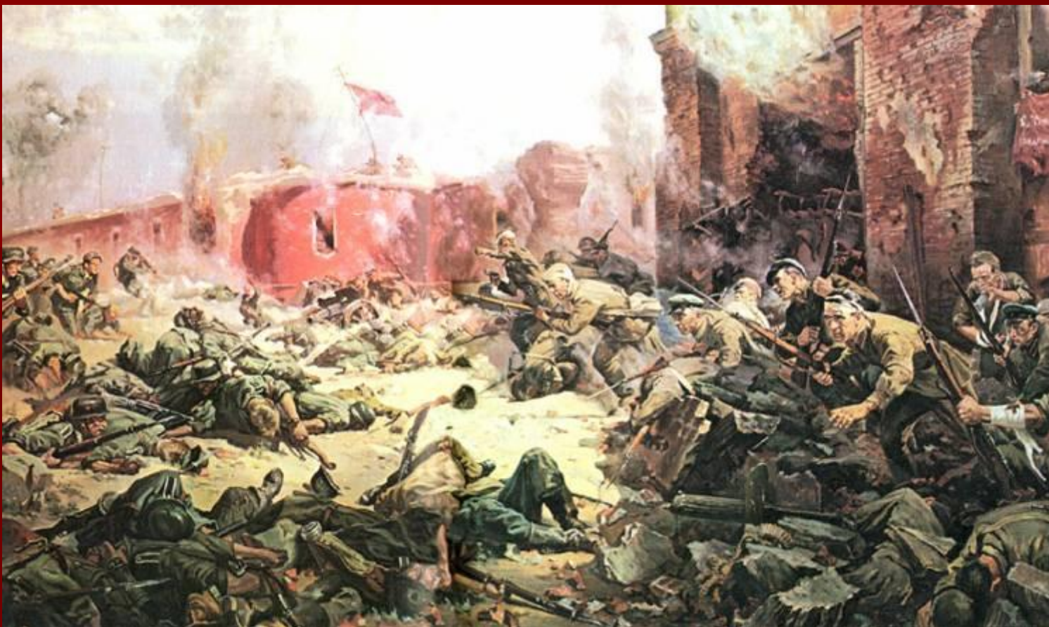
П. А. Кривоногов. «Защитники Брестской крепости».