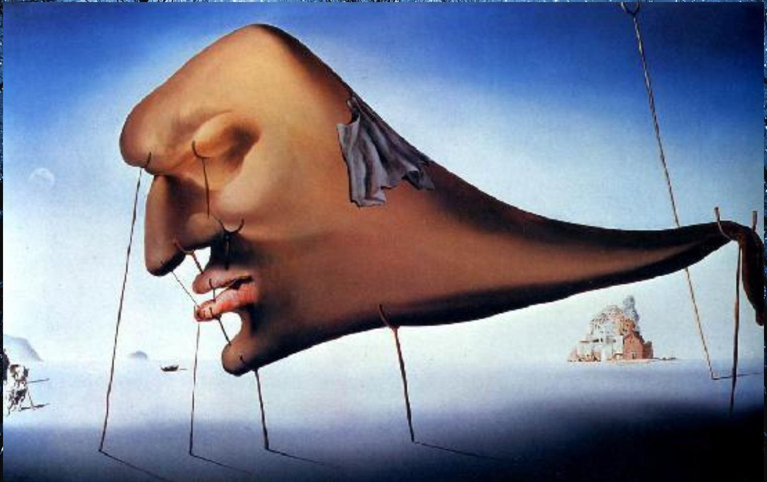
Сальвадор Далі "Сон"