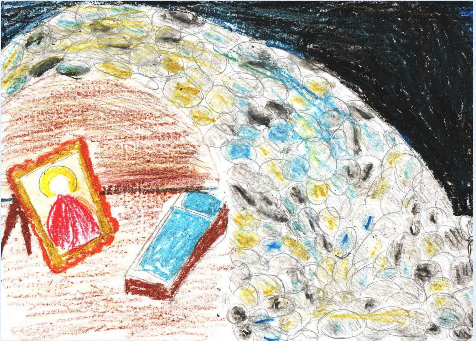
Келия там одинокая, Там Серафим обитал,