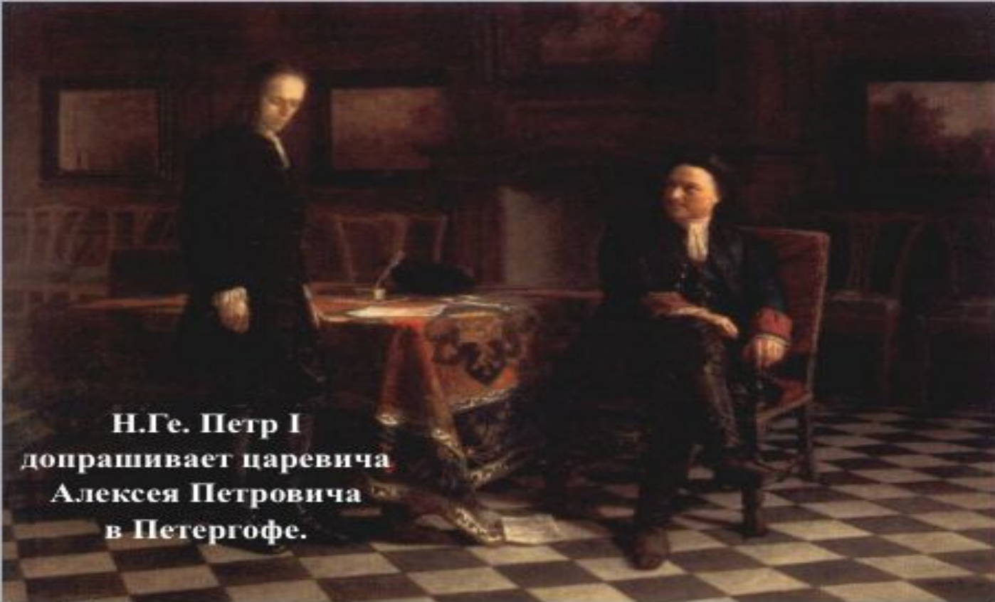
Н.Ге. Петр I допрашивает царевича Алексея Петровича в Петергофе.

Устав о наследии престола «дабы сие было всегда в воле правительствующего государя, кому оной хочет, тому и он определит наследство»