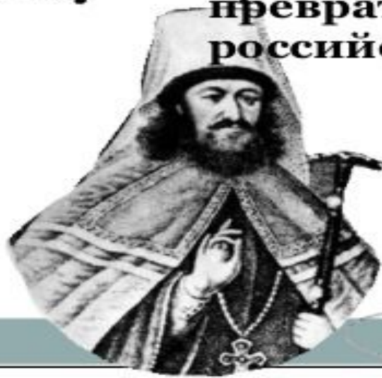
Стефан Яворский – местоблюститель с 1700 г.