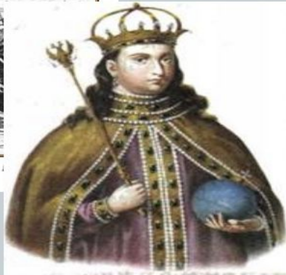
Царевна Софья Алексеевна