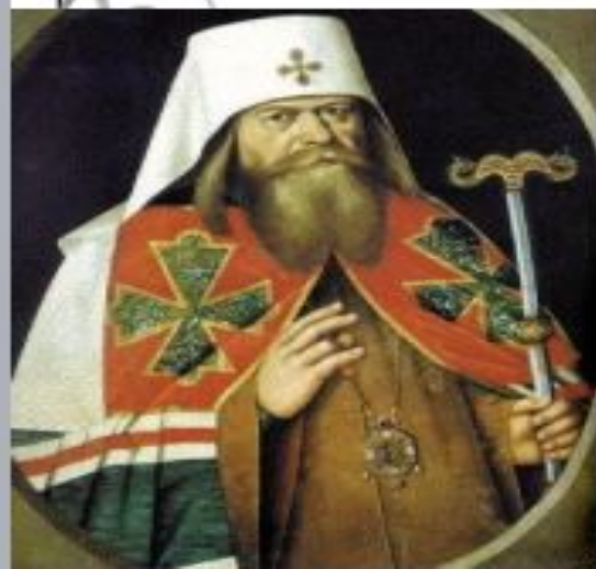
Патриарх Анриан (копия с парсуны XVII века)